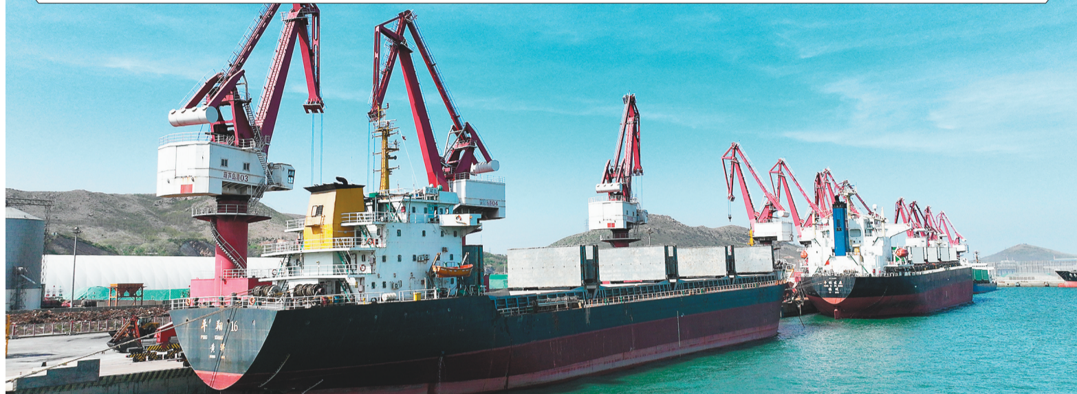
繁忙的葫芦岛港口。

高质量项目云集,夯实了葫芦岛市“十四五”时期七个“千百亿”产业集群的发展基石。一个基础化工及精细化工千亿级产业集群、清洁能源、有色冶金两个500亿级产业集群、船舶机械、战略性新兴产业、水产果蔬、泳装服饰、文旅康养五个百亿级产业集群,正在大手笔构筑多点支撑、多业并举、多元发展的现代产业发展格局,推动葫芦岛市的经济总量、增速、质量同步提升。