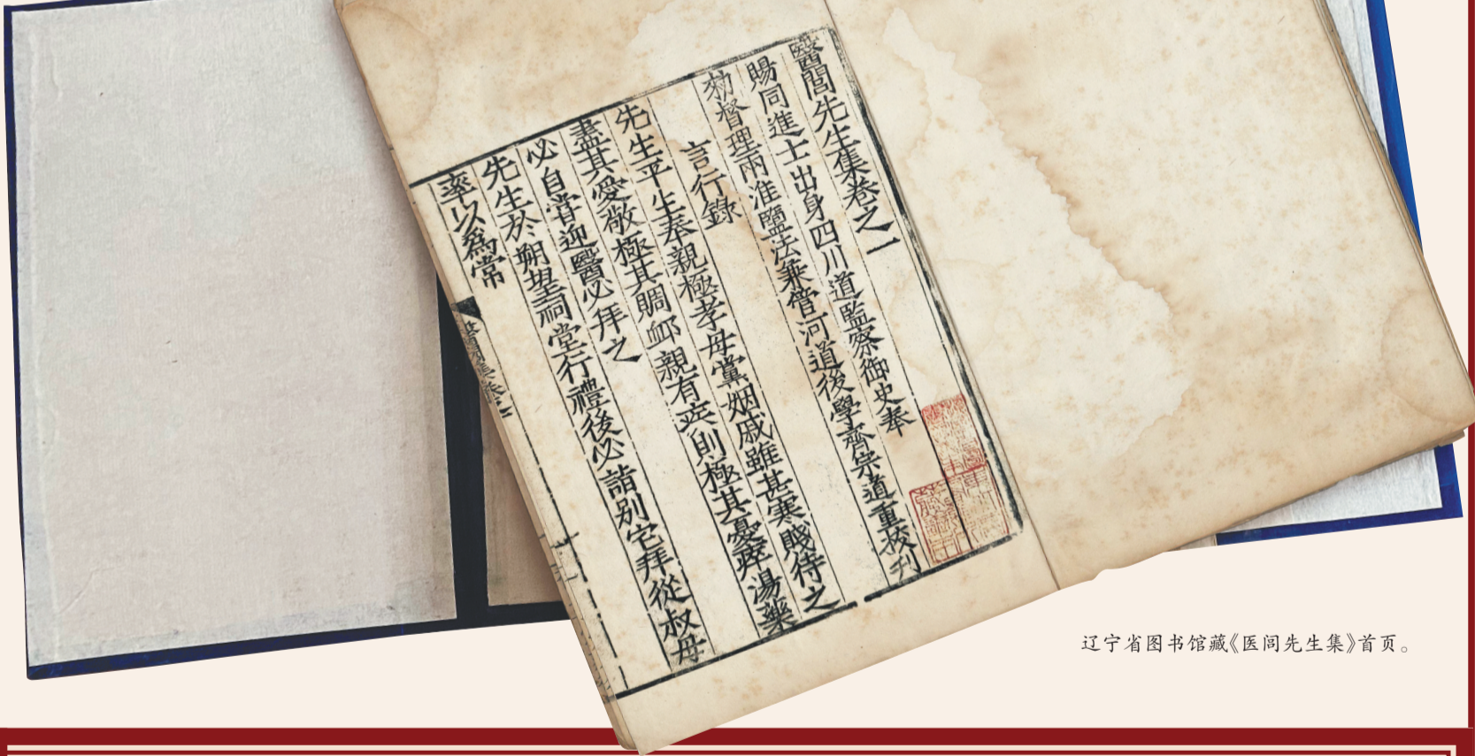
辽宁省图书馆藏《医闾先生集》首页。