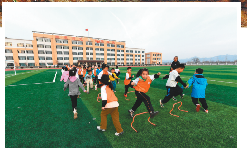
补齐民生短板,实施基础设施和社会事业项目22个,龙城区第一实验小学、朝阳一中西校区建成投入使用。图为龙城实验一小的孩子们在操场上锻炼身体。