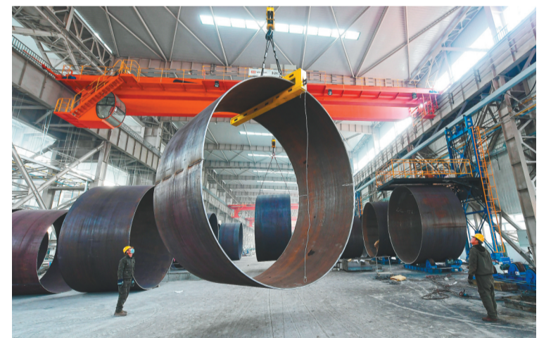
做大做强电子信息及装备制造这一主导产业,龙城区实施项目27个。图为投资5.2亿元的朝阳重型高端冶金装备及风电设备生产项目。

快书写新时代绿色发展新篇,实施清洁能源和绿色节能改造项目7个。130万千瓦抽水蓄能电站正在平洞勘测……积极推进全城工厂能耗绿色化,希波、辽远等10余户企业实施光伏绿电改造。发挥区位优势,龙城区全力打造辽冀蒙区域性物流中心。投资10亿元的西商农产品冷链物流园项目即将投入使用;柏慧燕都冷链物流仓储等项目计划年底建成投运;赤大白铁路煤炭物流基地投入运营,实现了公铁海联运联通。确保招商变成项目、项目变成投资、投资变成产业。龙城区全力推进的乡村振兴示范街路南部分区项目已经竣工,吸引了红托竹荪智能化种植等农业特色产业项目30个。征途漫漫,惟有奋斗。打造朝阳高质量发展先导区,龙城笃定前行。