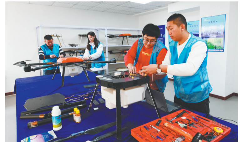
围绕打造“数字经济智造强市”样板区目标,龙城区“数字蝶变”的步伐不断加快。图为朝阳得帮创新科技有限公司员工在组装植保无人机。

全区复工项目 113 个 / 总投资 211 亿元 / 高新技术及新兴产业项目 48 个 /