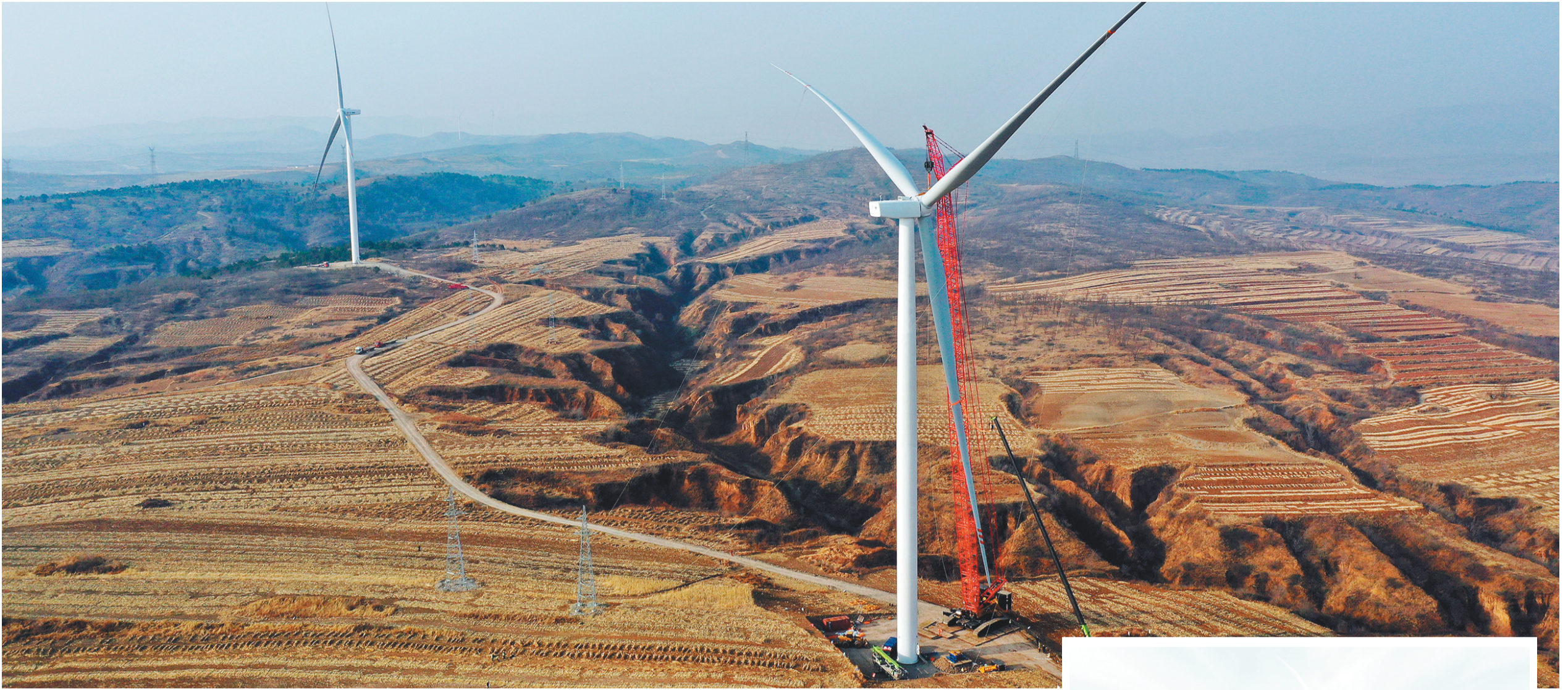
推动绿色低碳转型,龙城区全力推进清洁能源和绿色节能改造项目。图为在联合镇,嘉窝15万千瓦风力发电项目正在加紧建设中。