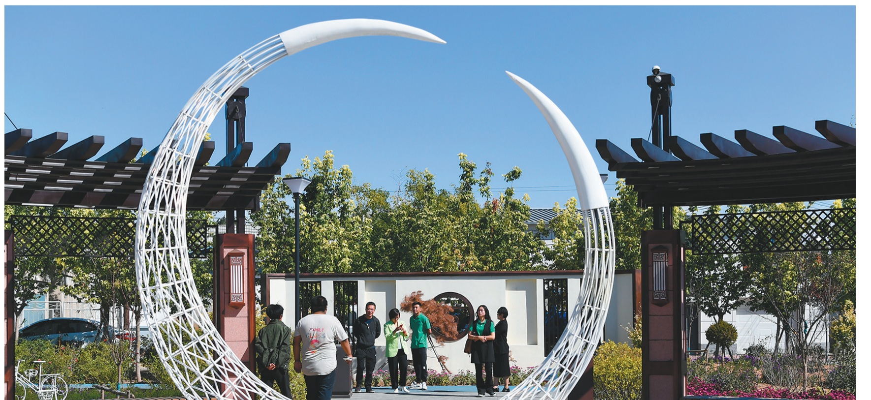
乡村振兴示范街路既是龙城区推进创城工作的重点项目,也是实现乡村振兴的创举。图为在推进乡村振兴示范街路工程中,多个“文化广场”“口袋公园”陆续建成。