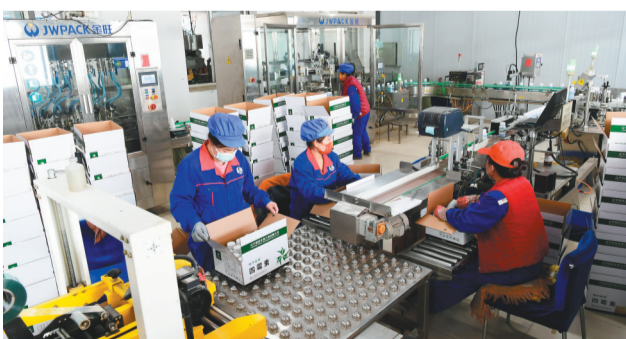
数字化升级改造后的辽宁微科生物工程股份有限公司已经成为全省微生物发酵领域技术领先企业。