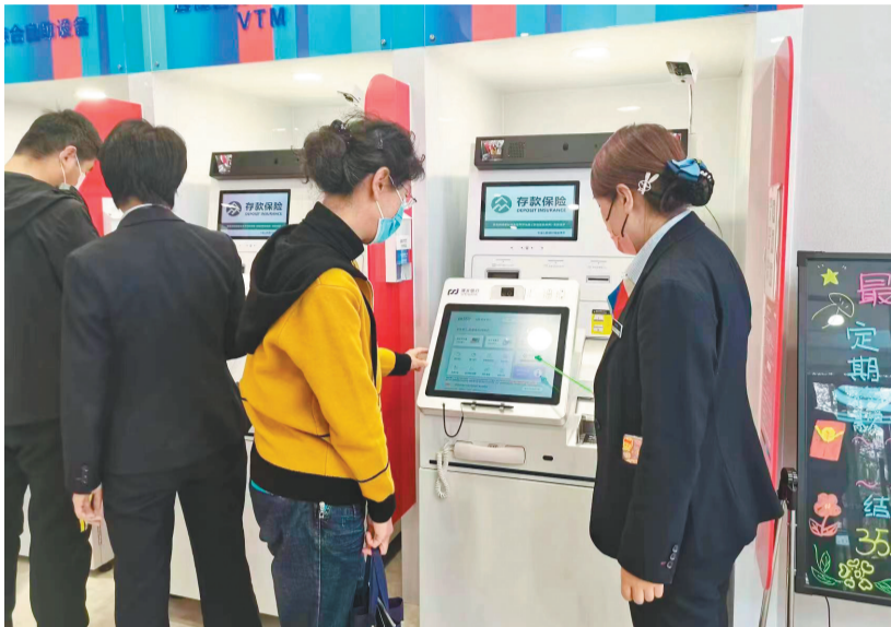
浦发银行网点员工接受企业客户咨询。

助力资源回收利用,减少环境污染。浦发银行沈阳分行坚持“生态优先、绿色发展”原则,近期成功为该行辖区内某危废治理企业投放了7000万元的绿色信贷用于其厂区建设、项目投资中,贷款资金将用于支付上游