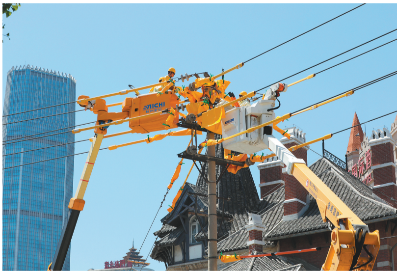
国网大连供电公司员工开展不停电作业,排除线路故障缺陷。

“发生停电时,智能电表宽带薪载波模块中的超级电容会发出‘求救信号’,及时上报停电信息,大数据平台