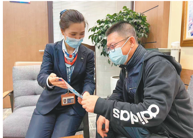
浦发银行网点员工向小微企业主介绍信贷产品。

随着传统产业向绿色高新技术应用转型升级,浦发银行沈阳分行正在积极拓宽实体经济绿色转型发展融资渠道,持续加大对生态环保、清洁能源、环保低碳等产业信贷支持力度,不断提升绿色金融服务能力,助力实体经济实现绿色转型发展。