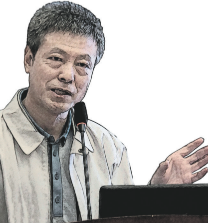
梁鸿鹰 文艺报总编辑