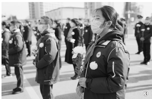
图①:这是12月13日拍摄的南京大屠杀遇难者国家公祭仪式现场。 图②:这是12月13日拍摄的南京大屠杀遇难者国家公祭仪式现场默哀。 图③:12月13日,人们在侵华日军南京大屠杀中山码头遇难同胞纪念馆前悼念。