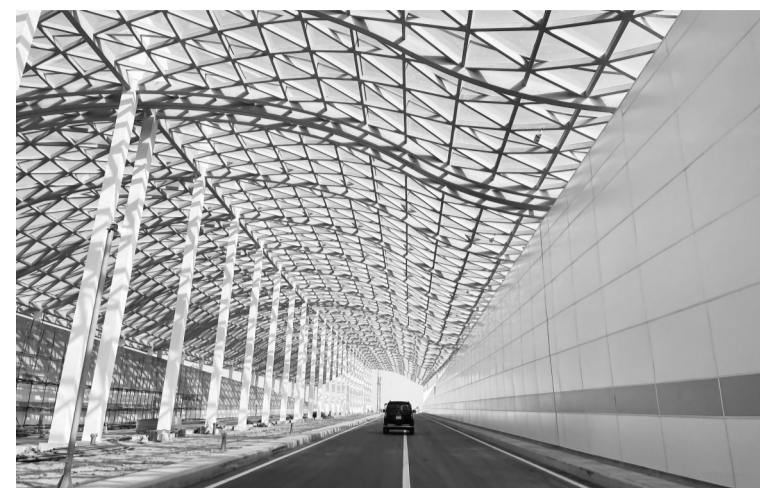
图为11月26日在孟加拉国吉大港市拍摄的卡纳普里河底隧道入口。由中国交通建设股份有限公司承建、中国路桥工程有限责任公司负责实施的孟加拉国卡纳普里河底隧道——孟加拉国河底隧道项目26日举行南线隧道竣工仪式。新华社记者 刘春涛 摄