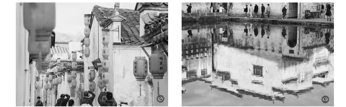
初冬时节,安徽省黄山市黟县的徽派建筑与自然环境融为一体,尽显诗画般的美丽图景。图①:11月23日拍摄的安徽省黄山市黟县宏村景色。图②③:11月23日,游客在安徽省黄山市黟县宏村内游览。