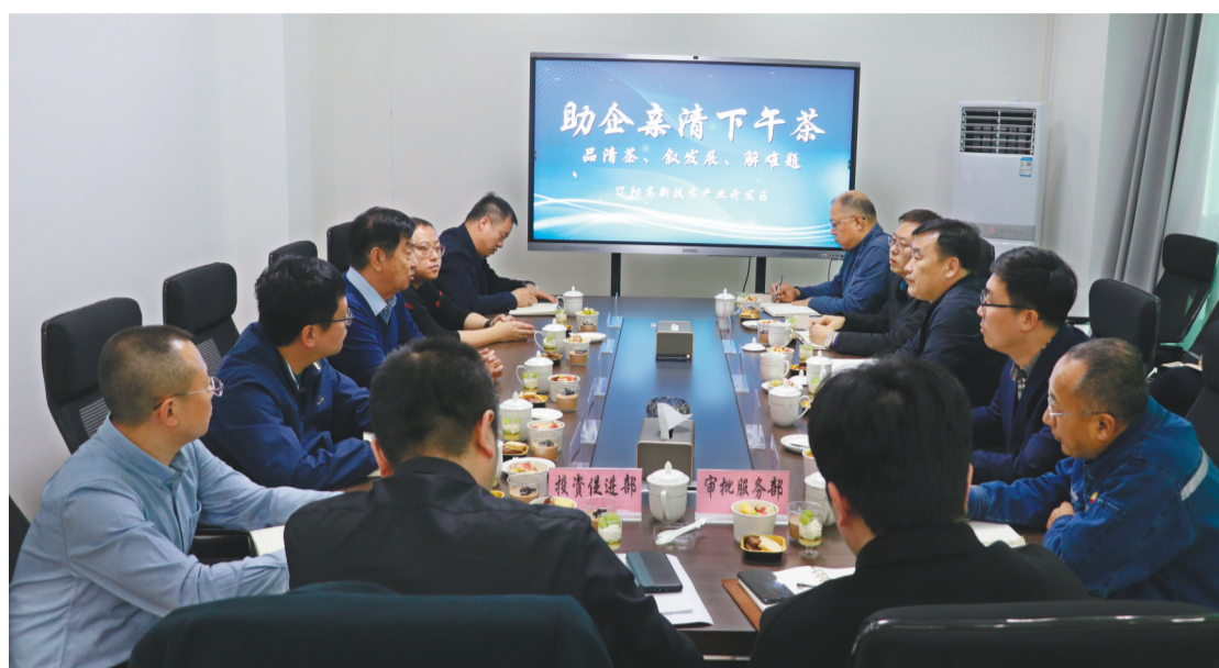
辽阳市宏伟区及辽阳高新区开展“助企亲清下午茶”活动，面对面为企业解难题。

按此要求，针对“下午茶”活动中各企业提出的问题，各相关部门主要负责人纷纷深入企业，