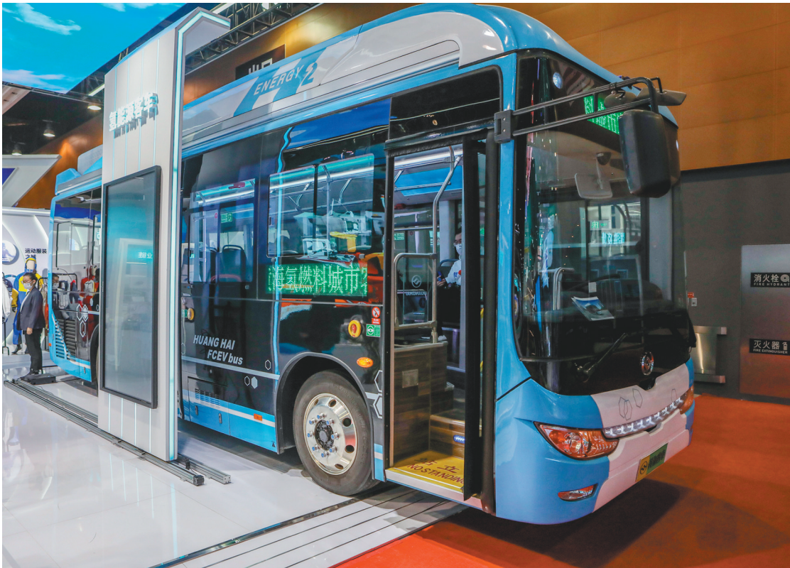
丹东黄海客车研制的氢燃料电池客车。