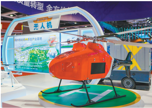
阜新海州智能无人系统产业基地生产的无人机。