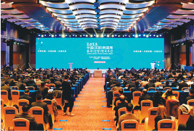
2022中国(沈阳)韩国周开幕现场。