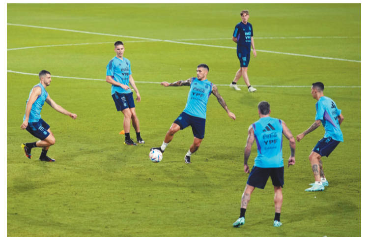
11月14日,阿根廷国家足球队在阿联酋阿布扎比进行赛前训练,备战即将开赛的卡塔尔世界杯。图为阿根廷队球员在训练中。