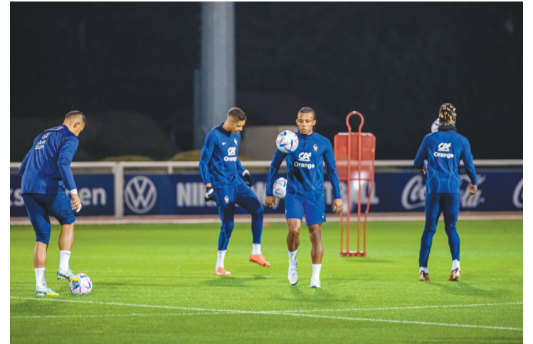
11月14日,法国国家足球队在巴黎南部的克莱尔方丹-昂伊夫林基地进行赛前训练,备战即将开赛的卡塔尔世界杯。图为法国队球员在训练中。

澳大利亚队目前星光黯淡,效力于亚洲五大联赛的球员屈指可数,他们在亚洲区比赛中也失去以往的强势。上届世界杯,对阵法国队、丹麦队的两场比赛,澳大利亚队均未获胜。本届世界杯,他们再次面对这两支欧洲强队,拿分更为困难。与突尼斯队的比赛,澳大利亚队有可能取得进球、获得积分。