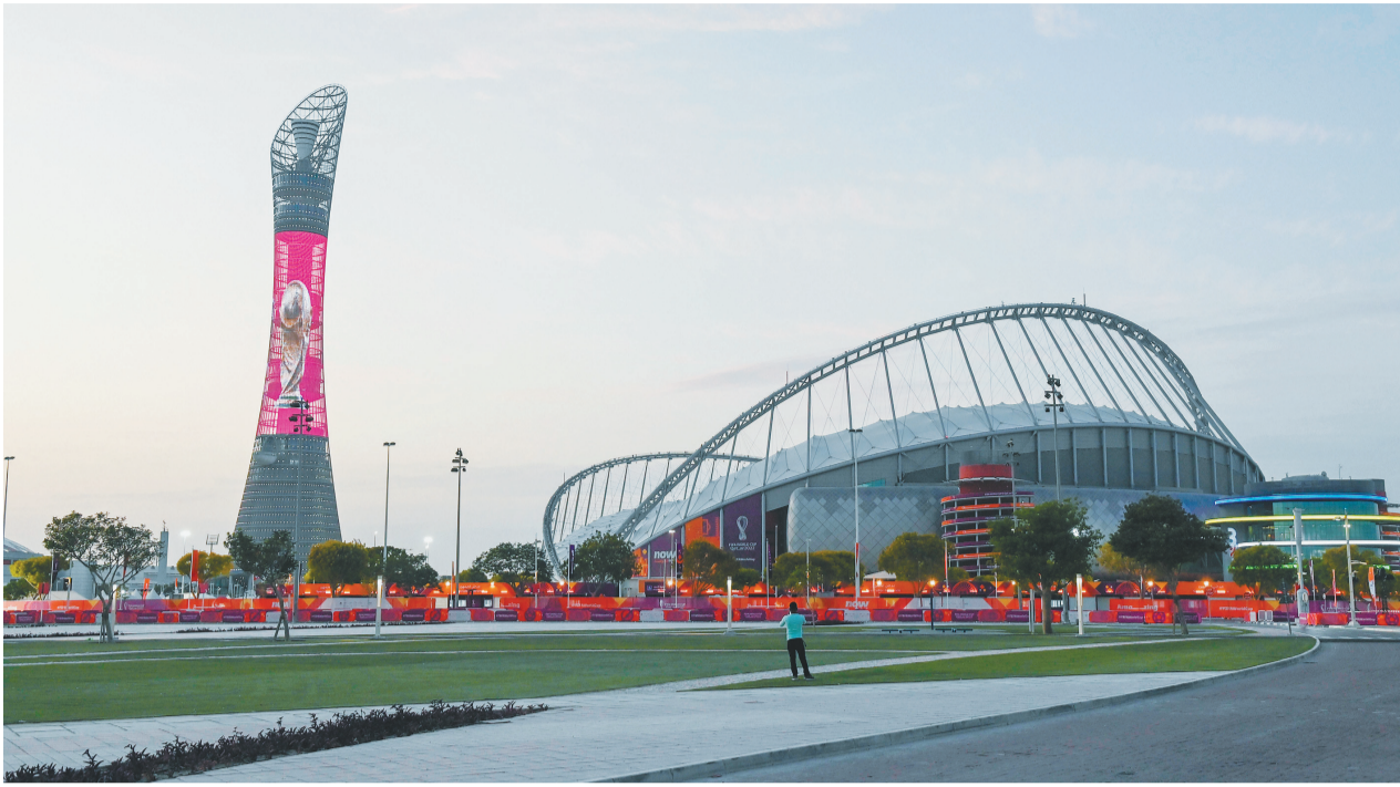
卡塔尔世界杯期间,哈里发国际体育场将举行8场赛事。图为哈里发国际体育场外景。