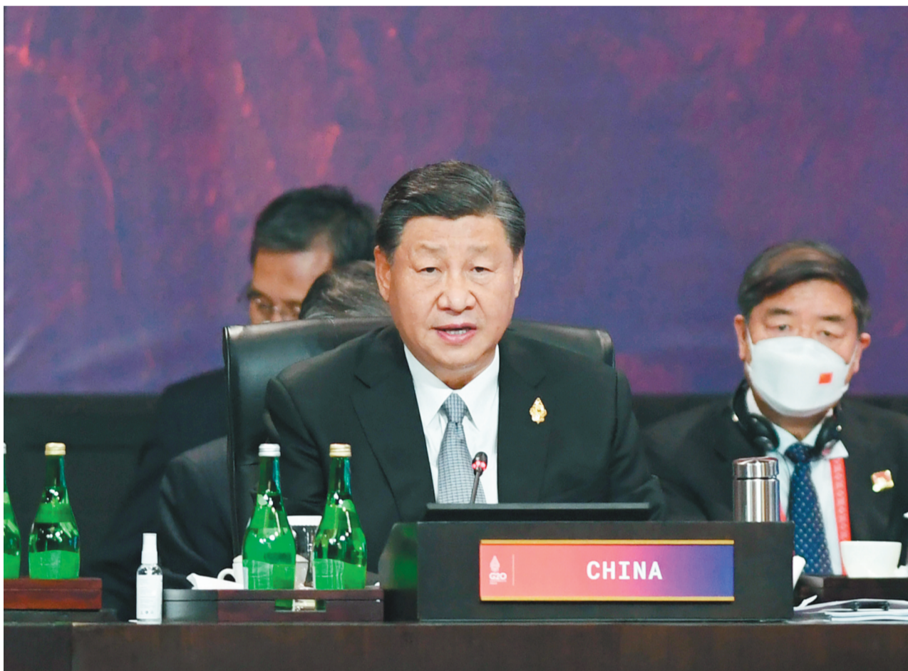
当地时间11月16日,二十国集团领导人第十七次峰会在印度尼西亚巴厘岛继续举行。国家主席习近平出席并发言。

新华社印度尼西亚巴厘岛11月16日电(记者白林 刘华)当地时间11月16日,二十国集团领导人第十七次峰会在印度尼西亚巴厘岛继续举行。国家主席习近平出席并发言。 在讨论数字转型问题时,习近平指出,当前,数字经济规模扩大,全球数字化转型加速,成为影响世界经济格局的重要因素。中国主办二十国集团杭州峰会期间,首次把数字经济纳入二十国集团议程,提出创新发展方式、挖掘增长动能。近年来,二十国集团在适应数字化转型、发展数字经济方面凝聚了更多共识,推进了更多合作。希望各方激发数字合作活力,让数字经济发展成果造福各国人民。