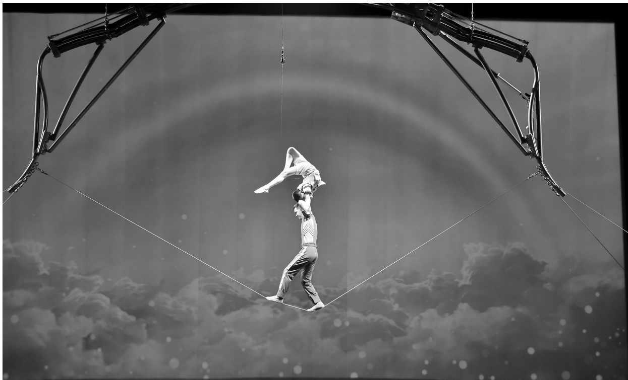
《双人升降软钢丝》为国内外首创首演。

11月13日,第五届中国杂技艺术节暨第十一届中国杂技金菊奖全国杂技比赛在河南省濮阳市落下帷幕,由辽宁省杂技家协会推荐,沈阳杂技演艺集团创演的节目《双人升降软钢丝》、大连杂技团创演的节目《蒲公英·远方一蹬伞》一路过关斩将,在30个精品节目的角逐中技惊四座,顺利摘得金菊奖。本届杂技艺术节共有10个项目获“金菊奖”,辽宁摘得两朵“金菊”,充分显示了辽宁杂技大省的实力和杂技强省的创新成果。