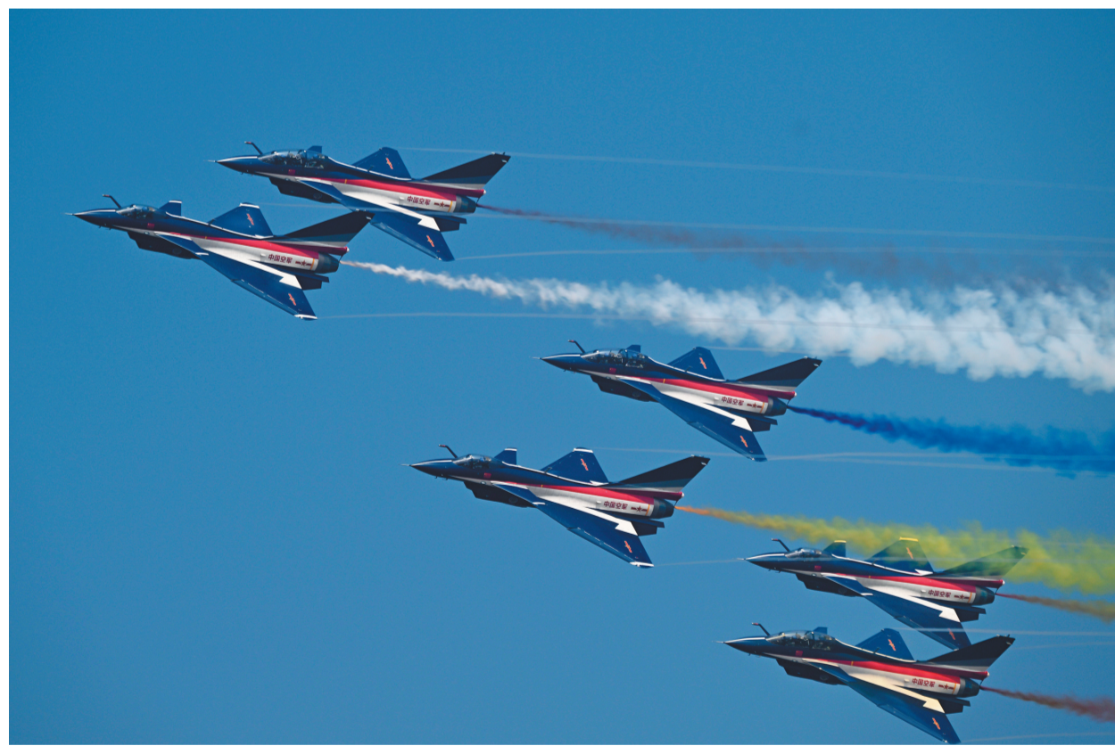
11月13日,第十四届中国航展闭幕当天,空军八一飞行表演队进行飞行表演。

在地面静态展示区,空军按照“制空作战与空中打击、无人与反无人作战、战略投送与空投空降、预警探测与