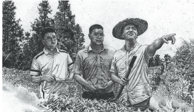
《直播带货 助农增收》 李非 作