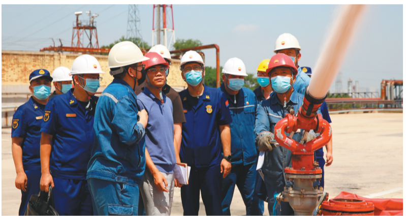
应急管理部检查组检查指导石化企业消防安全工作。

辽阳市还探索研发“重点单位数字化消防管理系统”APP,实现社会单位日常消防安全管理电子化、信息化和系统化,便于单位落实主体责任,监管部门实时监管。持续深化社会单位等级评定,消防控制室、微型消防站星级达标创建等做法,指导社会单位做好预案修订和疏散演练,组织辽阳市669家消防安全重点单位1300余名消防安全责任人、管理人召开消防安全大检查动员部署会暨重点单位集中约谈会,签订承诺书,推动单位落实消防安全主体责任。