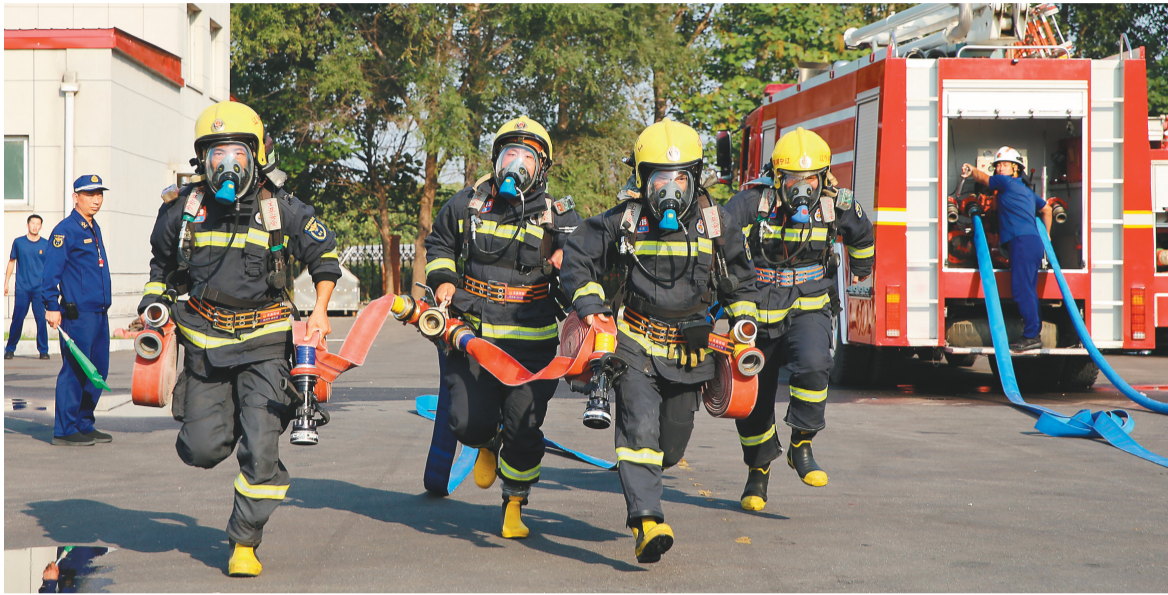
辽阳市消防救援支队开展岗位练兵比武竞赛。