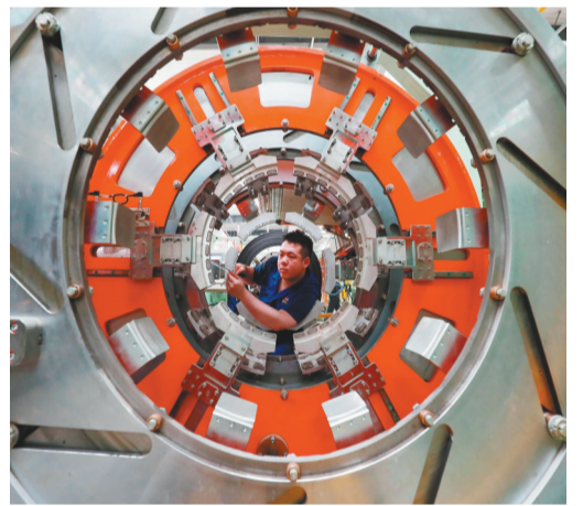
以朝阳浪马轮胎有限责任公司为引领,朝阳市企业瞄准“一带一路”沿线国家布局项目,开拓市场。图为朝阳浪马轮胎公司工程师在维护设备。