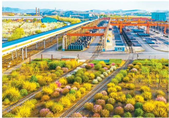
坚持“绿色低碳、专精特新”发展方向,凌源钢铁股份有限公司荣获第九届辽宁省省长质量奖金奖。图为凌源花园式工厂厂区。