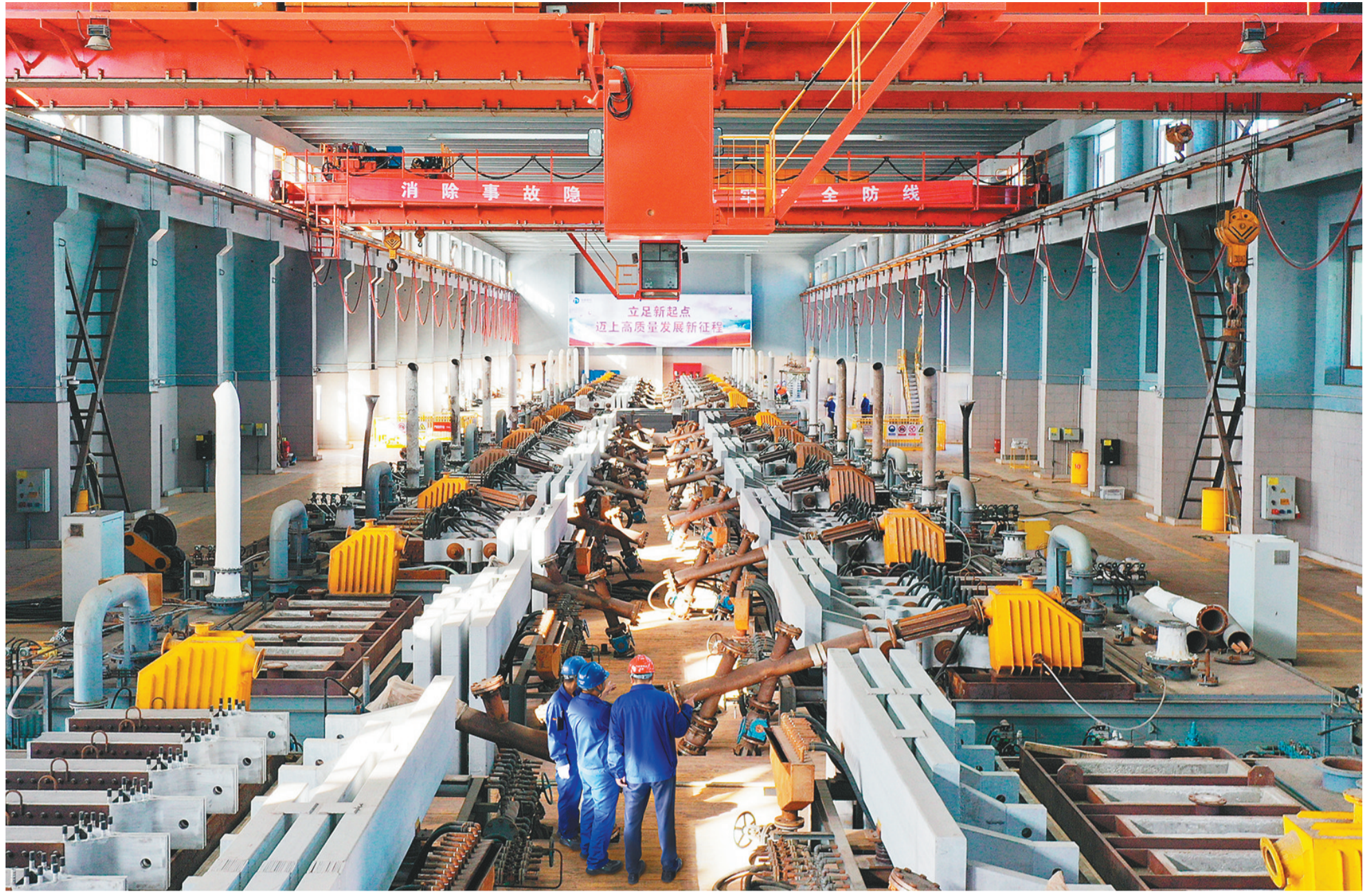
朝阳市坚持把着力点放在实体经济上,推进振兴发展。图为采用国际领先技术的朝阳金达钛业股份有限公司镁电解车间。企业已实现全创新链集成,其高端产品在全国市场占有率重要位置。