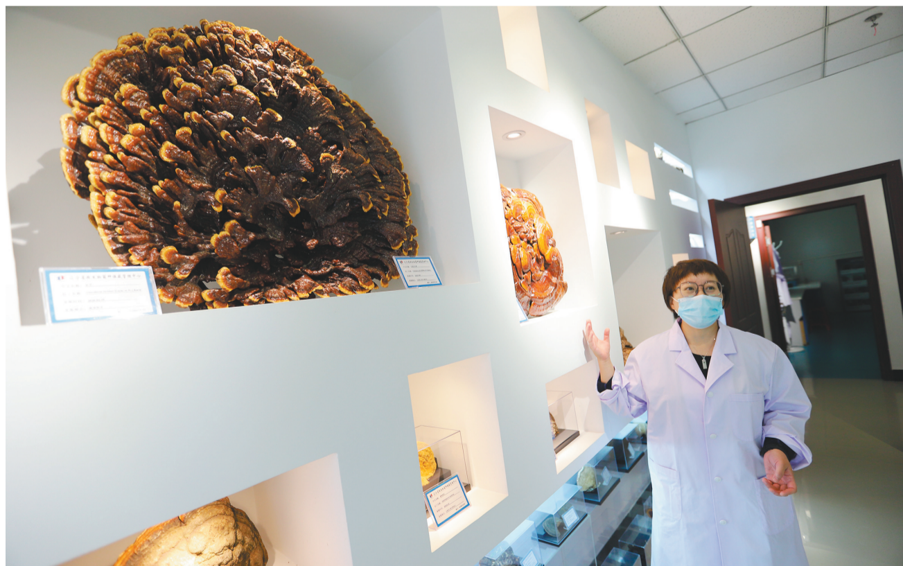
辽宁省微生物科学研究院围绕国家发展战略和农业发展需求,规划并建设土壤微生态、食药菌2个主导学科和生物饲料特色学科。图为研究院推进建设的辽宁省菌种资源共享平台已多次完成大型真菌标本采集。