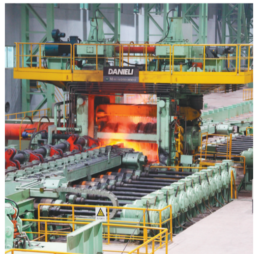
凌钢年产110万吨的国际先进大棒材生产线,依靠科技创新,使产品力大幅度提升。