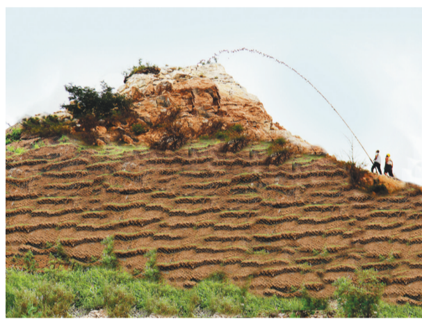
喀喇沁左翼蒙古族自治县跻身全国首批创新型县(市)建设榜单。图为喀左引进高次团粒喷播技术,开展裸岩造林和矿山植被恢复。