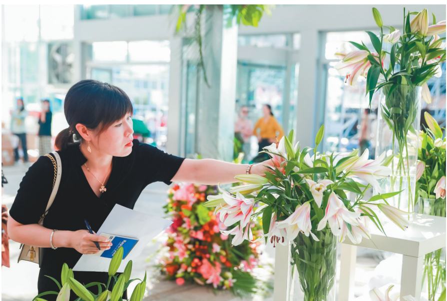
科技助力凌源花卉产业发展,这里拟打造国家球根花卉种球研发基地。图为中国凌源第四届百合节引进了480多个百合新品种,游客在赏花。