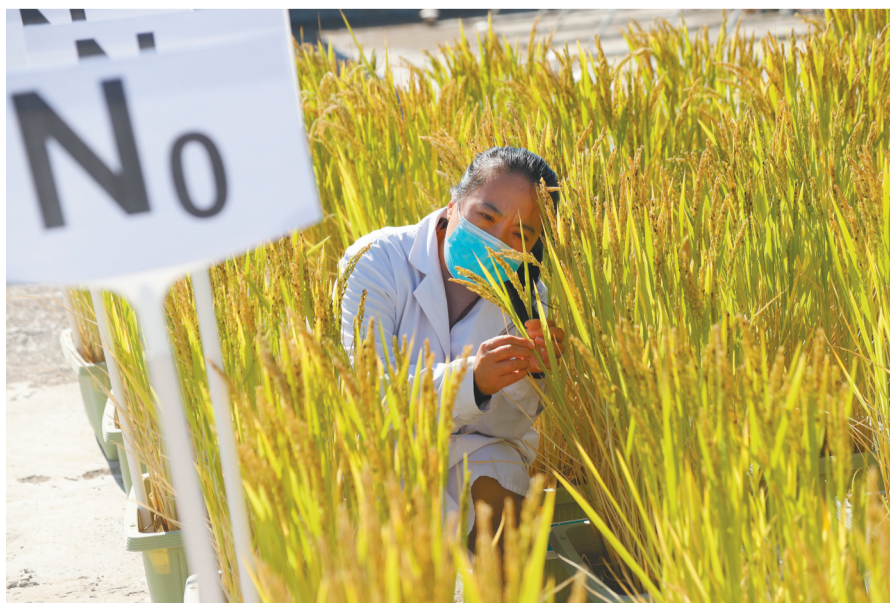
省微生物科学研究院依托科研课题开展重大科技成果培育等创新工作。图为稻田生态系统氮磷肥料减量技术试验中,科研人员在查看秧苗长势。