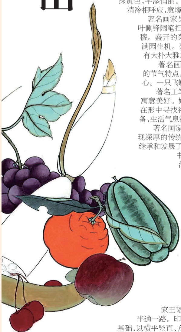
《蔬果图》(局部) 于非闇 国画