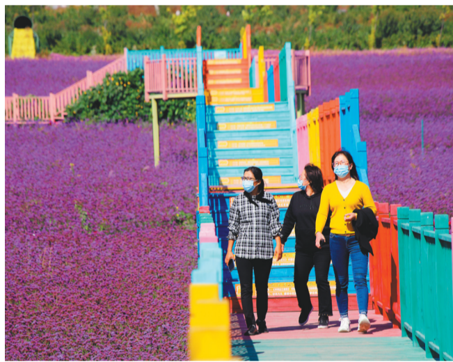
乡村旅游和发展生态经济相融,使水泉村跻身省乡村旅游重点村。图为游客在“润泽花海”游玩。