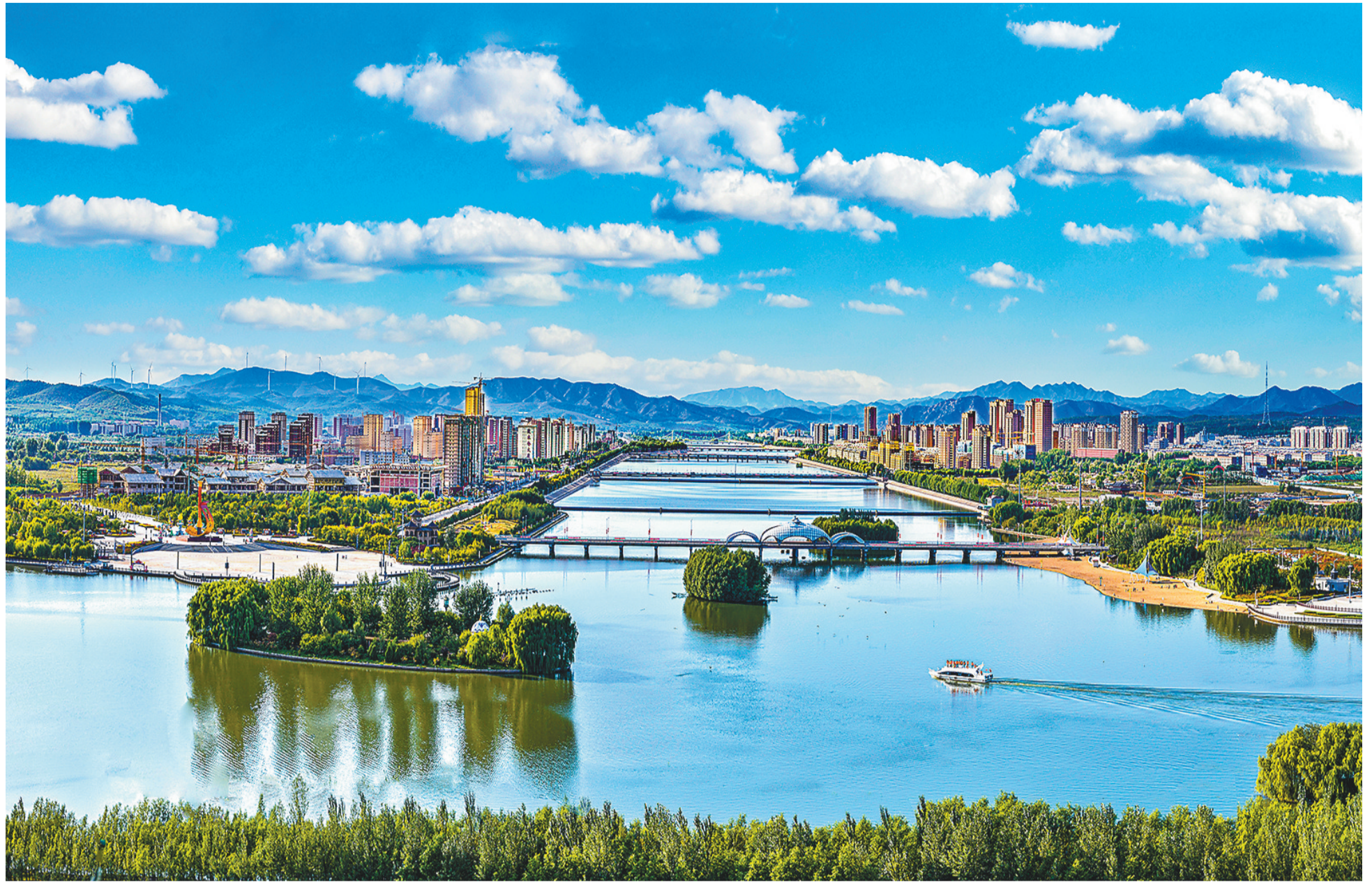
喀左旅游产业的核心——龙源旅游区总面积达36平方公里。图为被誉为“北方西湖”的龙源湖国家级水利风景区。