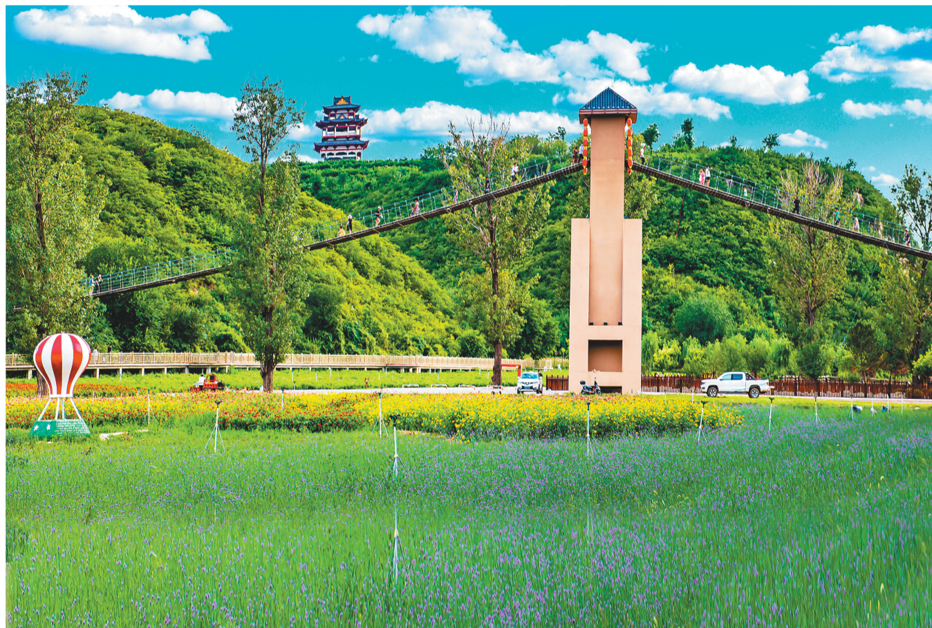
发展生态旅游,喀左坚持保护优先。图为教木伦湿地花海。