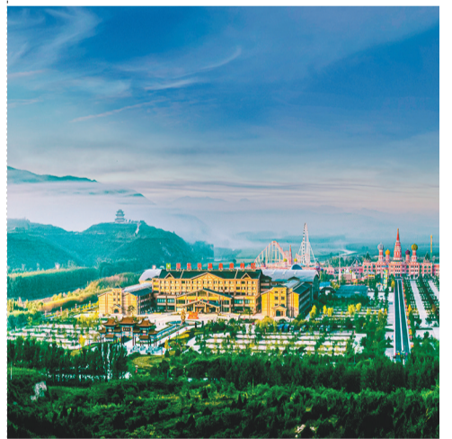
浴龙谷温泉度假区的建设发展,不断释放旅游产业拉动效应,扮靓乡村,致富农民。图为位于平房子镇小营村的浴龙谷温泉度假区。