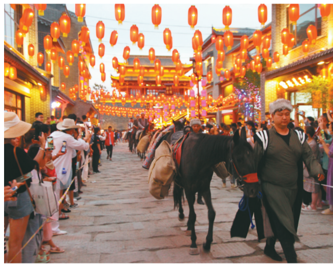
利州古城为省级夜间文化和旅游消费集聚区。图为古城重现“商队进榷场”。