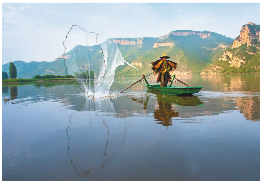
绿水青山展开喀左乡村振兴的美丽画卷。水泉镇以旅促农,农旅互动,持续增加农民收入。