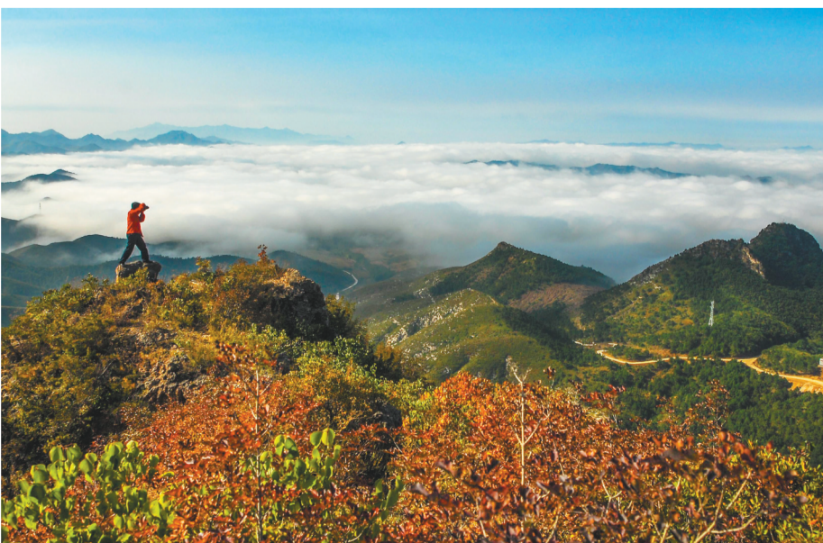
龙凤山是古人类的居住地,这里有天然岩洞70多处,且洞外镶洞、洞内藏洞、洞洞朝阳,故称“朝阳洞”。图为远眺龙凤山。

若来一场说走就走的旅行,“全国文明县城”“中国最美生态宜居旅游名县”——喀左欢迎您。