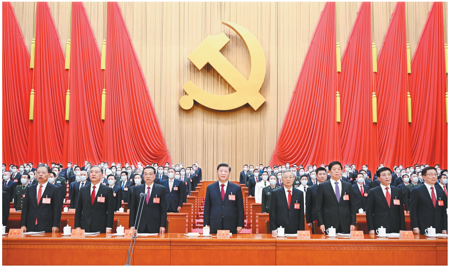
10月16日，中国共产党第二十次全国代表大会在北京人民大会堂开幕。这是习近平、李克强、栗战书、汪洋、王沪宁、赵乐际、韩正、胡锦涛在主席台上。

新华社北京10月16日电 凝心聚力擘画复兴新蓝图，团结奋进创造历史新伟业。举世瞩目的中国共产党第二十次全国代表大会16日上午在人民大会堂开幕。