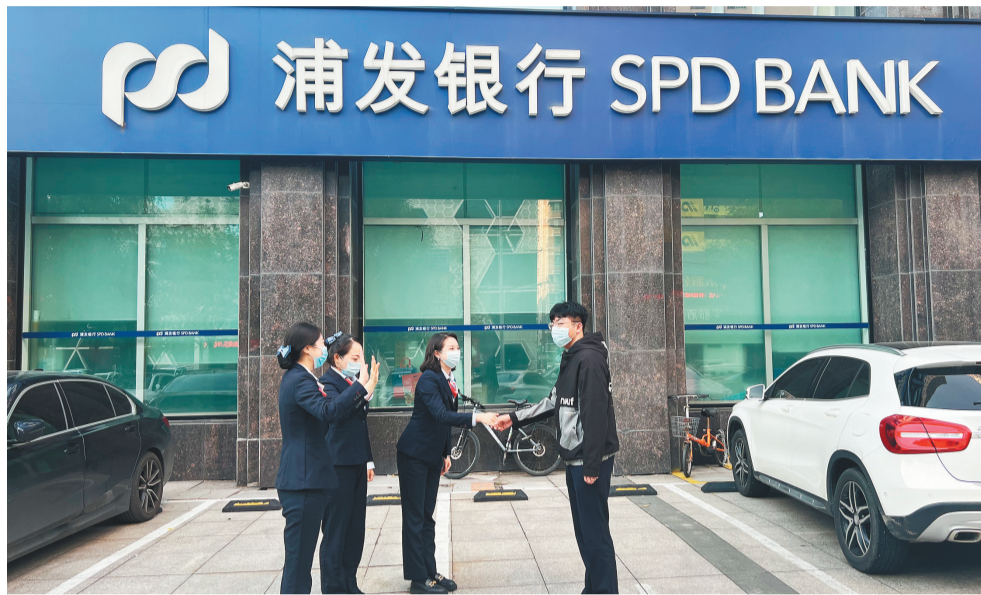
浦发银行工作人员迎接客户到网点办理业务。

2014年,富创精密迎来工艺积累和技术攻关的关键时期,浦发银行沈阳分行经过充分的市场调研和数据分析,准确评估该企业的科技潜力及市场前景,率先入局,制订方案,陆续为企业搭建起专属配套金融服务,并在2017年摆脱房产等不动产抵押贷款融资掣肘,结合科创企业实际情况,以企业机器设备为担保的创新形式,发放流动资金贷款4000万元,为企业技术研发和市场开拓装上“新引擎”。