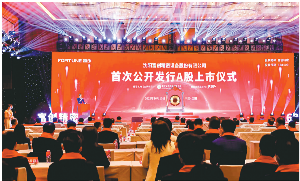
沈阳富创精密设备股份有限公司在上交所上市。

2022年10月10日,随着一声钟声响起,沈阳富创精密设备股份有限公司成功在上海证券交易所科创板挂牌上市。辽宁省及沈阳市相关领导出席上市仪式并致辞,省、市各级政府职能部门负责人出席活动,浦发银行沈阳分行党委书记、行长李国光作为嘉宾代表浦发银行参加上市发行仪式并与相关负责人进行了深入交流。