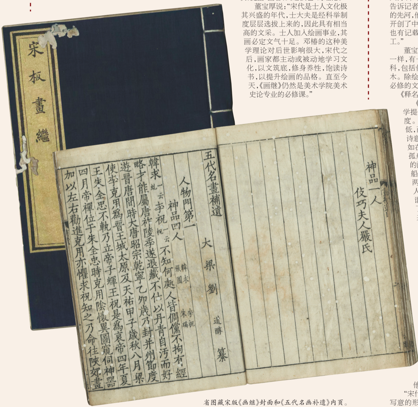
省图藏宋版《画继》封面和《五代名画补遗》内页。