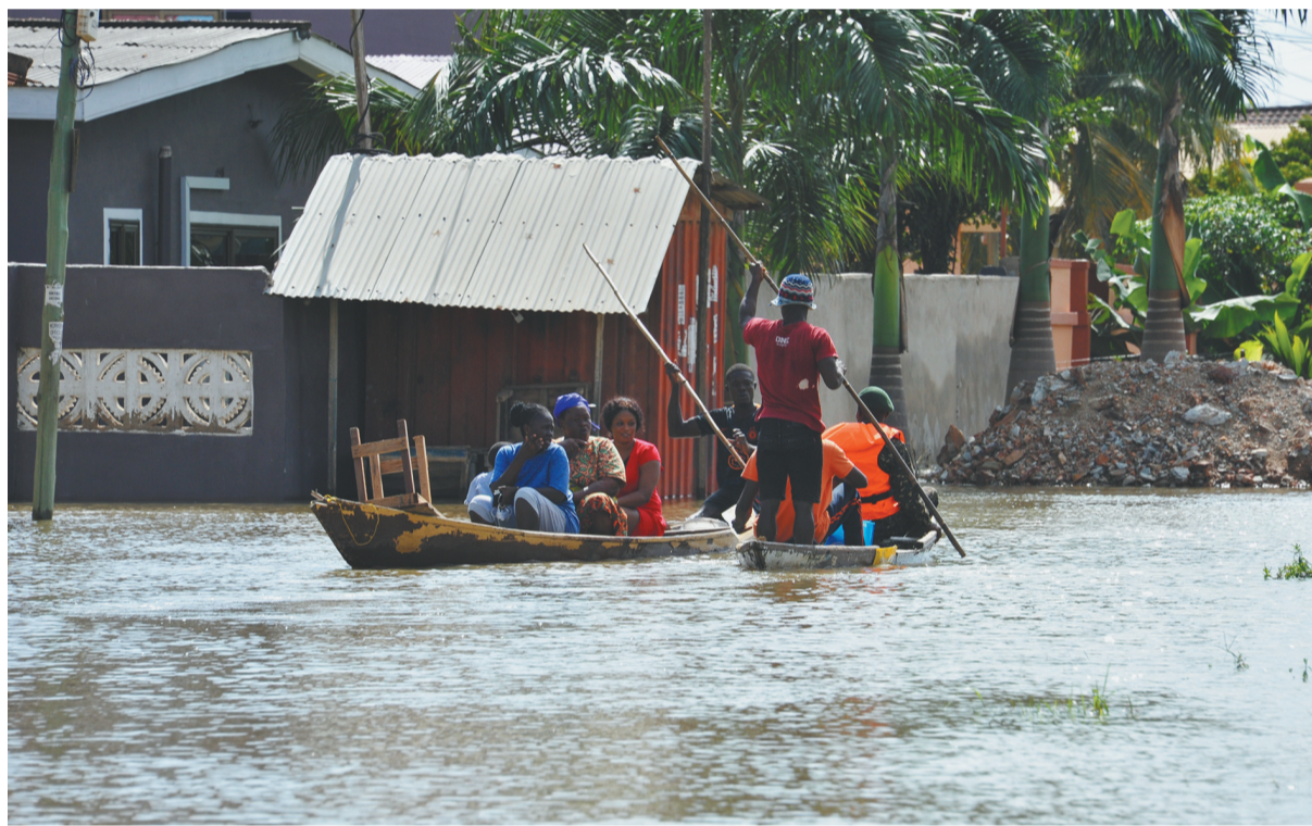
近日,加纳首都阿克拉西南部发生洪灾。洪水冲毁了许多房屋和道路交通设施,数千名居民生活受到影响。图为人们在加纳首都阿克拉西南部一处居民区乘舟出行。