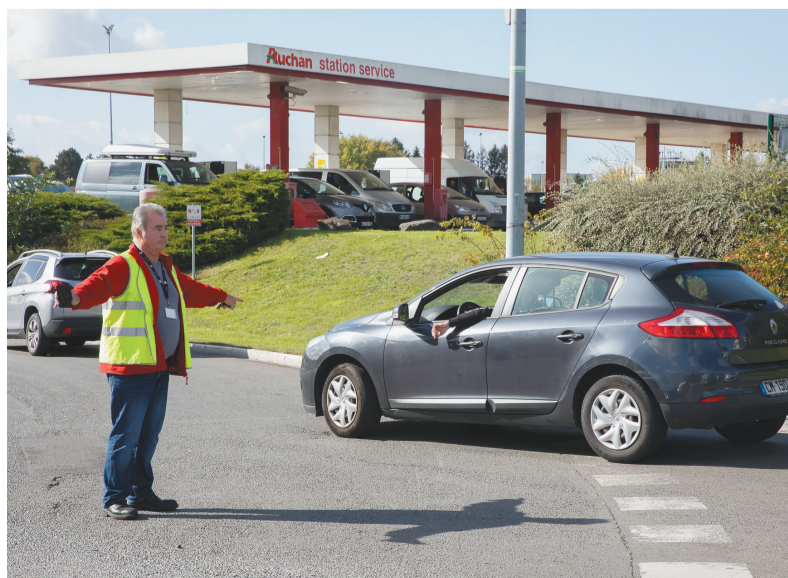
10月6日,在法国北部城市里尔,欧尚超市的加油站前车辆排起长队。