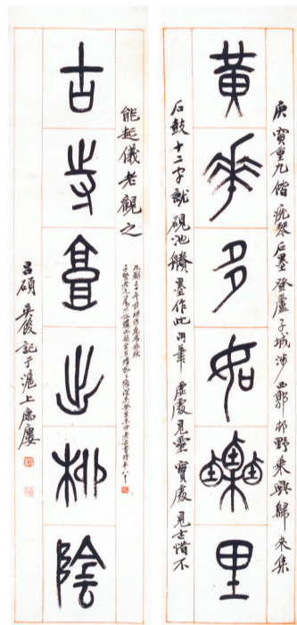
《重九篆书黄花古寺六言联》篆书 吴昌硕 “黄花多如粟里，古寺高出柳阴”