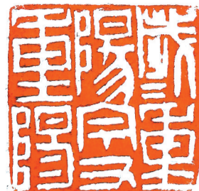
《岁岁重阳 今又重阳》篆刻 刘鹏