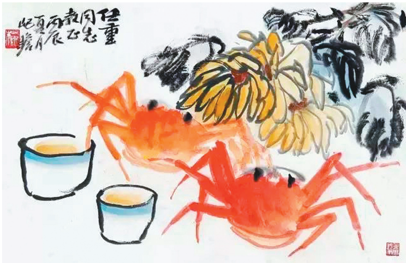
《重阳菊蟹肥》国画 朱纪瞻