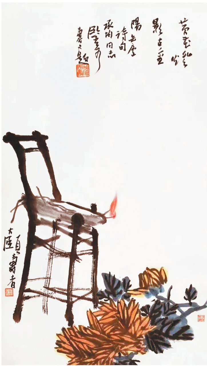
《黄花灯影古重阳》国画 潘天寿