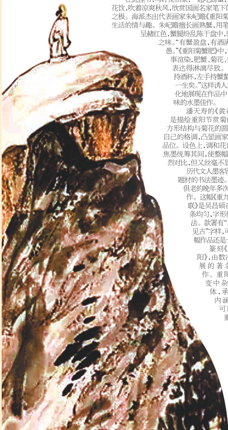
《重阳登高图》(局部) 国画 张大千

因日与月皆逢九，又称“重九”，古人认为是吉祥的日子。九在《易经》中为阳数，“九九”两阳数相重，故曰“重阳”。