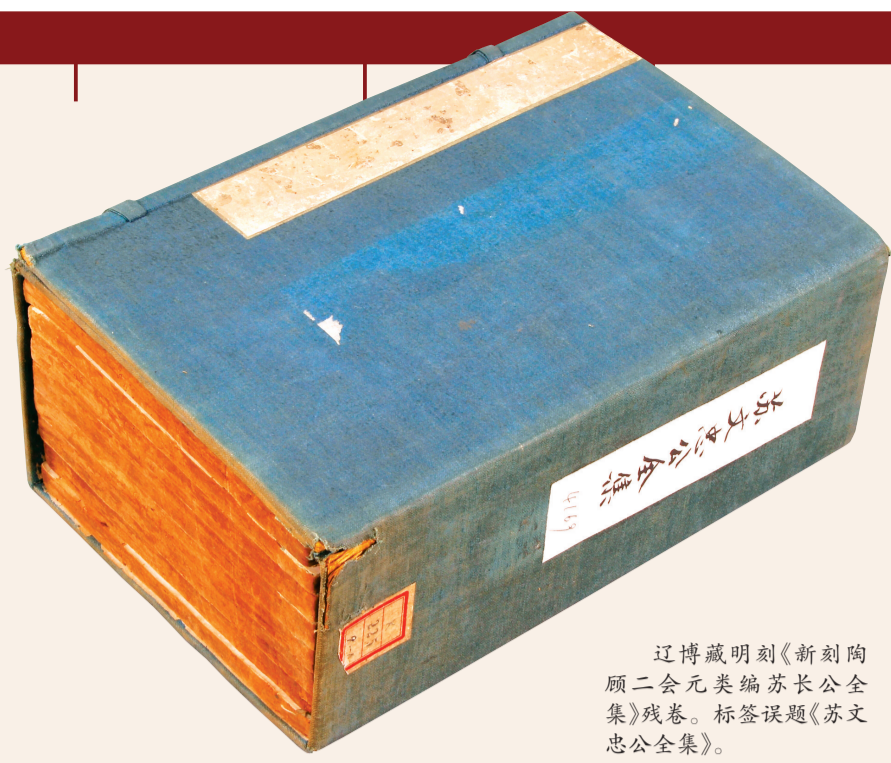
辽博藏明刻《新刻陶顾二会元类编苏长公全集》残卷。标签题《苏文忠公全集》。