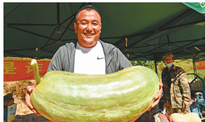
朝阳市龙城区海龙街道农民抱着丰收的大菜瓜。