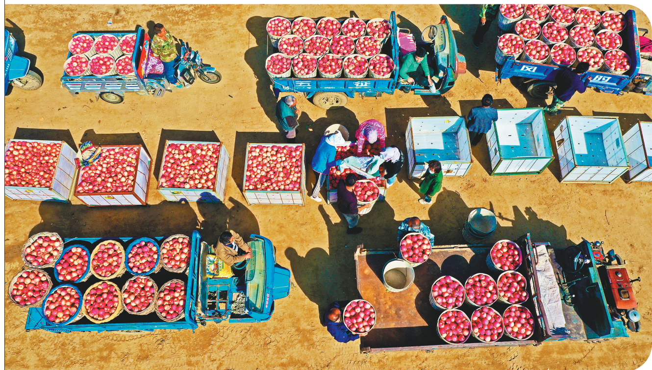
9月26日一大早,各地苹果收购商赶到瓦房店市万家岭镇,让当地果农尝到家门口快速销售苹果的甜头。

春生夏长,秋收冬藏。在这个金色的时节,希望的田野上,让我们一起看风景,庆丰收、迎盛会、话丰年。