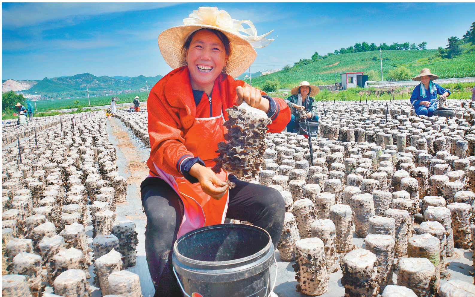
抚顺市东洲区哈达镇关山村木耳基地的村民在采摘黑木耳。