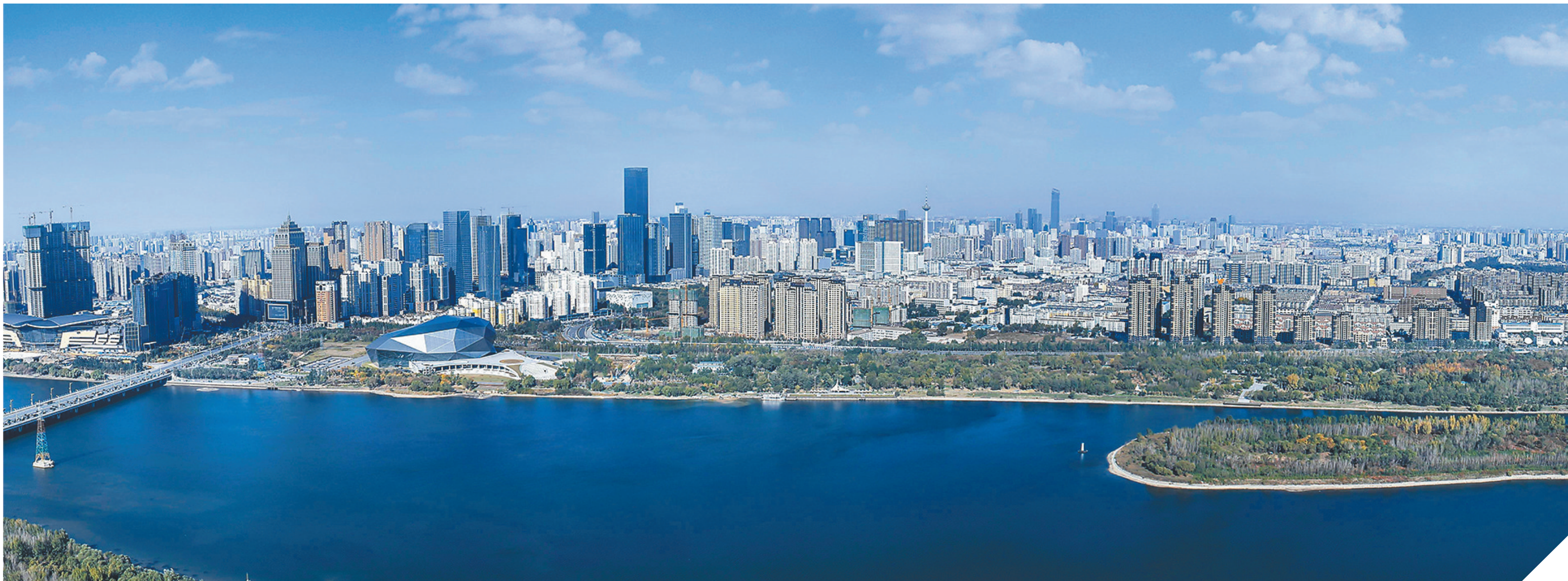
远眺沈河,水清岸绿城美。