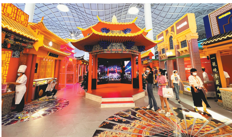
沈阳中街商户组团亮相2022年第二届中国国际消费品博览会。