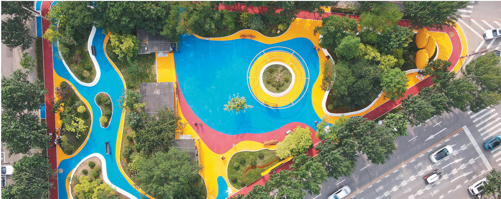
今年新建成的以“童趣”为特色的交行北口口袋公园。