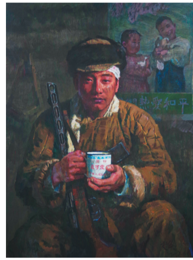
油画《最可爱的人》 吴云华 作