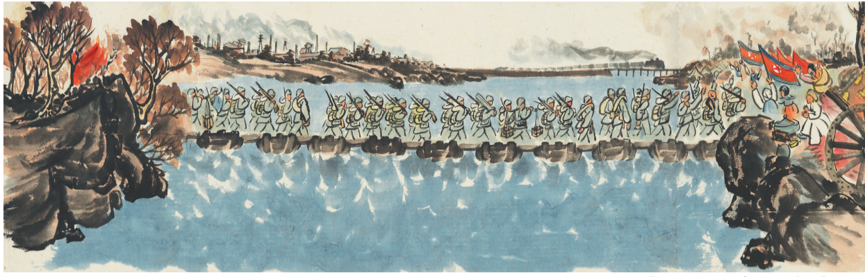
满健的《抗美援朝战争画卷草图》手稿。

核心提示 英雄远去，精神永存！9月15日，由鲁迅美术学院主办的国家艺术基金2022年度传播交流推广资助项目“喜迎党的二十大 永远跟党走”——抗美援朝美术作品暨创作手稿展在沈阳开幕。此次共展出100余幅手稿和900余幅展品，其中不少收藏于各级博物馆的经典作品创作手稿首次与公众见面，具有较高的艺术价值和珍贵的历史文献价值。