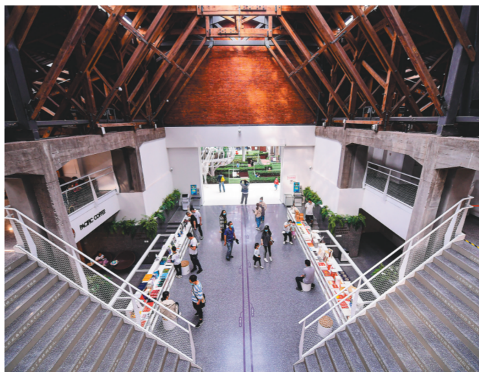
时代文仓书房已成为沈阳市网红打卡地。