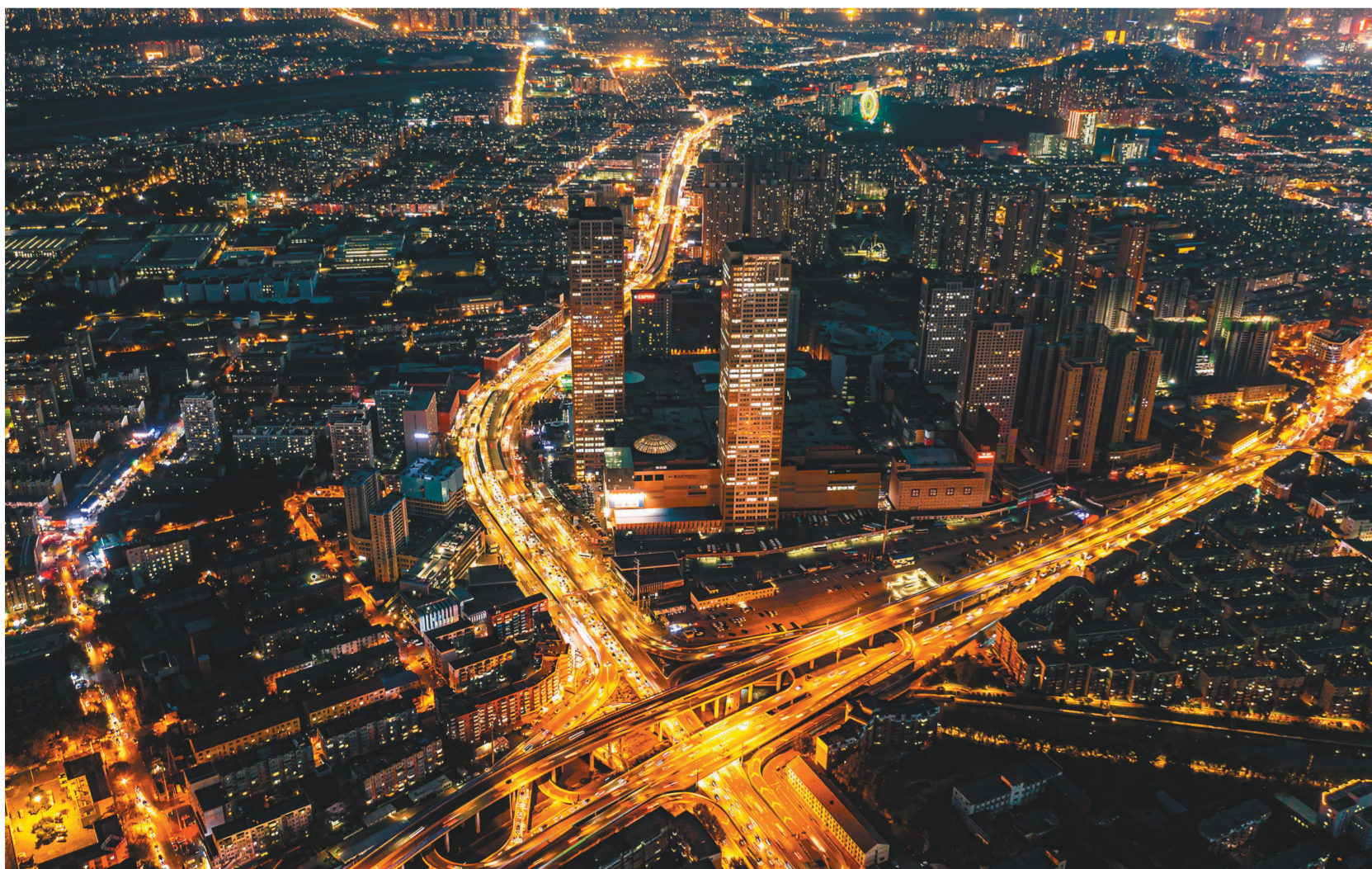
夜幕下的大东区灯火璀璨。

织密“一张网”,架起党群“连心桥”。大东区将网格作为服务居民、保障民生的第一线,通过合理划分设置1360个网格,确保每个网格都有党组织,每名党员都在网格中,通过“支部建设在网格、信息来源于网格、问题解决在网格”,打