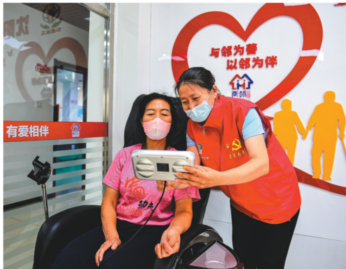
社区志愿者帮老人体验综合性养老服务。