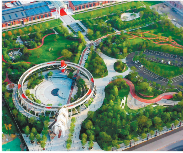
建设口袋公园,塑造环境更好,品质更优,功能更全的中心城区风貌。

梧桐繁茂风自幽。今年下半年,大东区将持续加快破除高质量发展的突出瓶颈问题,充分激发体制机制活力。坚持“高效率”“非诚勿扰”“不求人”,深化拓展方便快捷的审批服务模式应用,实现新办企业办理执照、印章刻制、发票申领、银行开户“一日办结”,推动移动审批大厅进园区、进商圈,115项便民服务事项下社区,推动政务服务更加便捷、高效。