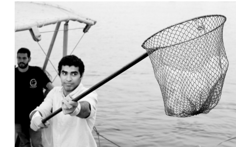
上图:9月17日,在毗邻埃及首都开罗的巴萨,环保志愿者用从尼罗河中捞取的塑料垃圾搭建“金字塔”。