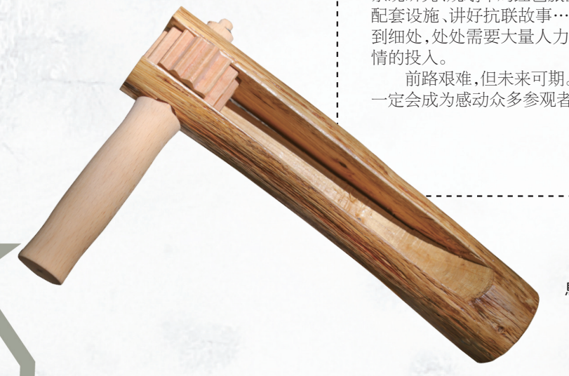
抗联战士传递消息用的啄木(复制品)。

如今80多年过去了,啄木鸟密码早已失传,但啄木鸟留了下来。附近老乡都知道,抗联传信啄木鸟。