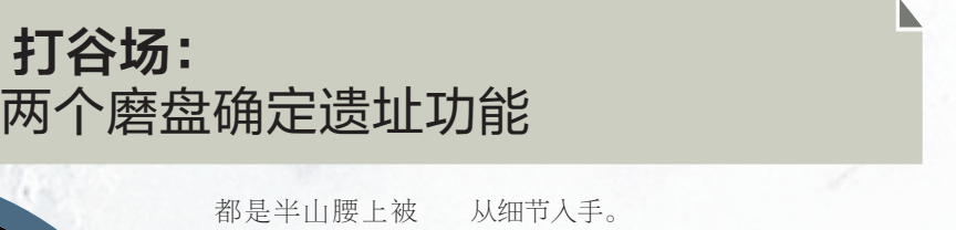
打谷场:两个磨盘确定遗址功能