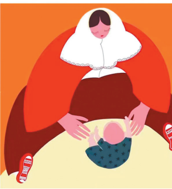
数字插画《LOVE》体现母爱情怀。