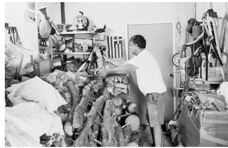
图为一名男子在希腊雅典的家中堆放柴火。雅典当地政府近日在一处市政公园内为民众提供免费柴火,以应对冬季的来临。