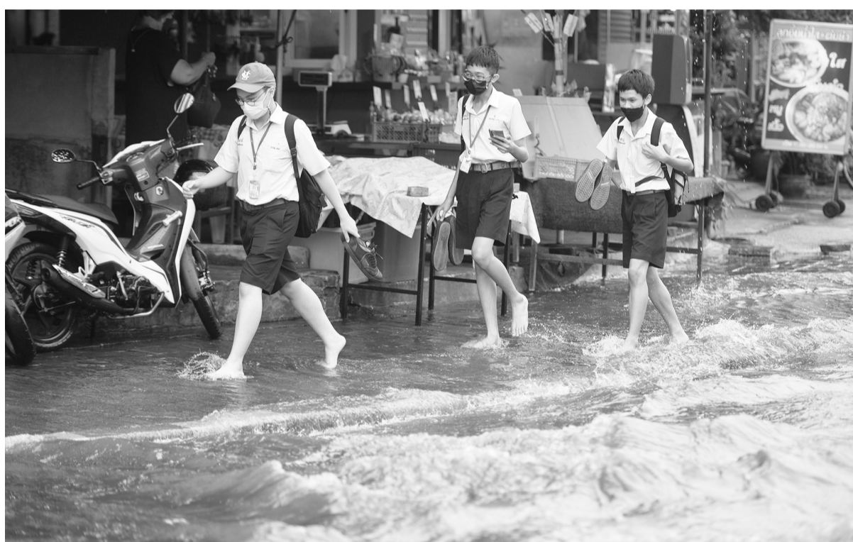
9月13日,在泰国曼谷,人们走过积水的街道。曼谷及周边地区近日降雨偏多,引发洪水。