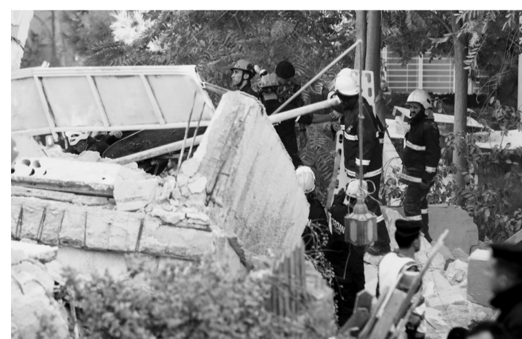
9月13日,救援人员在约旦首都安曼的居民楼倒塌事故现场工作。安曼一栋四层居民楼13日倒塌,造成至少5人死亡,7人受伤。