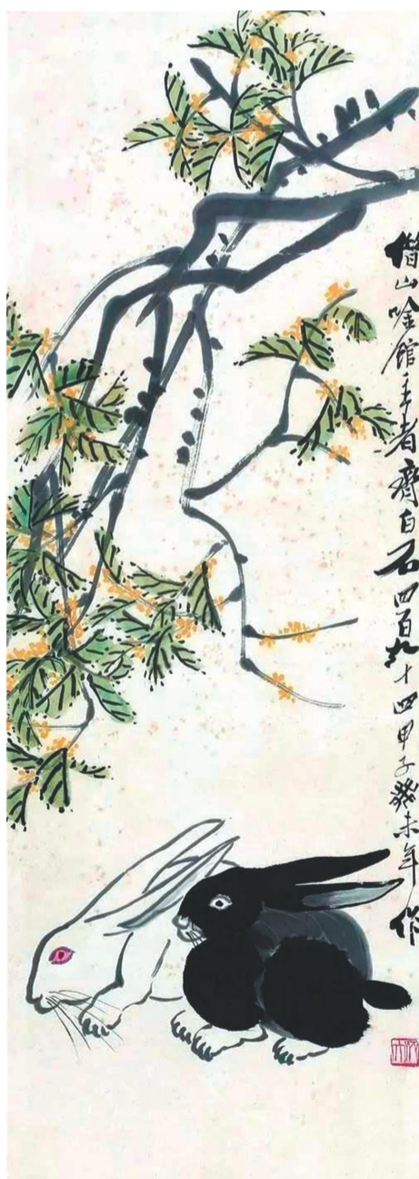
《桂花双兔图》纸本设色 齐白石