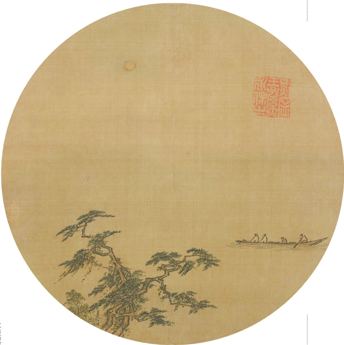
《松溪泛月图》团扇 夏圭(南宋)