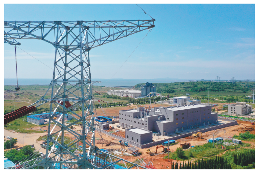
图为投入运营的500千伏冷家变电站。