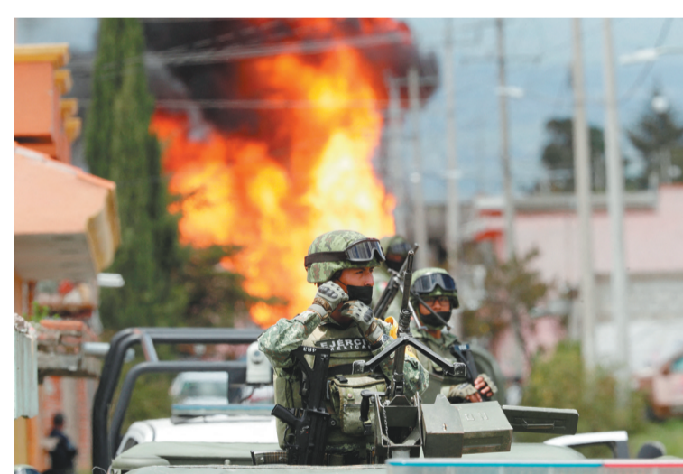
8月26日,在墨西哥阿莫索克-德莫塔,士兵在爆炸现场附近执勤。据路透社报道,26日,墨西哥阿莫索克-德莫塔一处燃气管道在维护时发生爆炸。