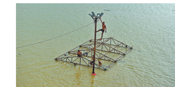
上图:8月25日在印度安拉阿巴德拍摄的被洪水包围的房屋。