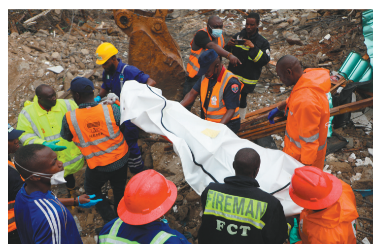
8月26日,救援人员在尼日利亚首都阿布贾西北郊区布瓦区的楼房倒塌现场工作。尼日利亚首都阿布贾市郊一栋在建三层楼房26日倒塌,导致2人死亡,4人受伤。