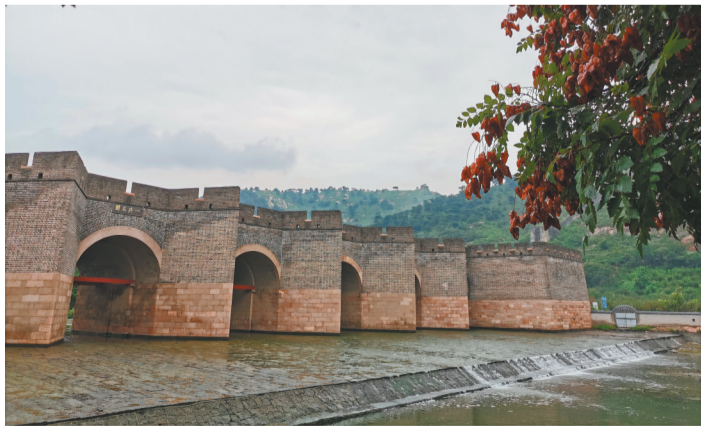
九门口长城是国家长城文化公园建设的重点内容之一。

不远处,一处闲置多年的中式建筑正在变身“九门口长城博物馆”。这个博物馆集合了长城营造、长城功能、长城故事等丰富内容于一身,并有机融合了实物展览与数字化展示功能,不仅可以立体式呈现九门口长城的“前世今生”,而且还能将全国长城历史进行全景式介绍。