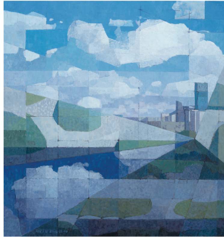
油画《盛京大剧院·G小调》 沈阳画家 刘旭 作

沈阳画作中,刘旭的油画作品《盛京大剧院·三和弦》《盛京大剧院·G小调》两幅作品描述沈阳浑河岸边的日新月异的变化。康翠微的《似水年华》用画笔讲述沈阳中街的故事。工业是沈阳城市文化基因的重要组成部分,康翠微的另一幅油画《身姿依旧》中巨大的工业机械装置吸引了观众的注意。画家将艺术与工业和城市进行结合,让画作更有温度,拉近了观众与工业文化的距离。此外,沈阳画家曹明的人物作品、郑州画家张阳丽的山水作品、沈阳画家曹伟的花鸟作品都表现出画家对大自然和乡土人情的关注。而于晨的油画作品《红瓶花卉》,红瓶里的红花、粉花、黄花、蓝花在静静地绽放,在展厅柔和的光照下,仿佛讲述东北大地田野的芬芳、红红火