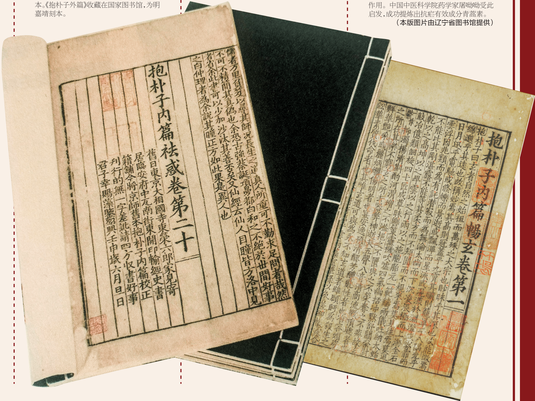
省图藏宋刻《抱朴子内篇》。

《抱朴子内篇》有多个版本存世。目前最早的版本为敦煌写本，但仅存《畅玄》《论仙》《对俗》三篇。省图藏宋刻本《抱朴子内篇》是现存最早的足本，曾被很多人收藏。明代画家、书法家、文学家、鉴藏家文徵明，清代季振宜、徐乾学都收藏过此书，后来入藏清宫。东北解放后，入藏辽宁省图书馆。 与《抱朴子内篇》相比较，葛洪传世的另一部著作《肘后备急方》影响较大，实用性较强。《肘后备急方》是中国古代最早的医疗临床急救手册，也是民间普及中医药知识的最早教科书之一。最值得称赞的是，这本书在全世界范围内首次对天花、恙虫病、血吸虫病、结核病的病状进行了详细的描述。 葛洪最早提出“疠气”的概念，认为各种急性传染病并非鬼神作祟，而是由自然界中一种不同于“风寒暑湿燥火”等六淫之气的“疠气”所造成的。还记载了恙虫病，是由恙虫的幼虫（恙螨）作为媒介而散播的一种急性传染病。直到上世纪20年代，国外才逐渐发现了恙虫病的病原。 天花是最古老也是死亡率最高的传染病之一。《肘后备急方》准确地详细地描述了天花的典型症状，并第一次提出了治疗方药。西方科学界普遍认为是阿拉伯医生雷撒斯最早记载了天花，事实上葛洪比他早了500多年。 葛洪还第一次记载了狂犬病，提出“以毒攻毒”的治疗思想，是人工免疫法的先驱，比西方早1000多年。同时他还最早记载了结核病，书中不仅明确记载了肺结核的病状和发病过程，而且还指出其具有传染性，将其称为“尸注”。 葛洪在《肘后备急方》中，创立了多种急症治疗技术，大大提高了急症治疗效果，包括人工呼吸法、洗胃术、救溺倒水法、腹穿放水法、导尿术、灌肠术等。 在《肘后备急方》中，葛洪对疟疾种类、症状与治疗的描述和对药物“分类归整”“药证相应”的整理，对后代医学具有启迪作用。中国中医科学院药学家屠呦呦受此启发，成功提炼出抗疟有效成分青蒿素。