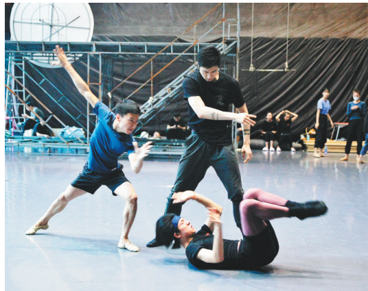
辽芭演员正在“连轴转式”地排练。

而不舍的精神,如今,辽宁芭蕾舞团已经成为在国内外具有较高知名度的芭蕾舞剧团,也成为我省一张文化名片。据悉,芭蕾舞剧《铁人》将参评今年全国文华奖和“五个一工程”奖。