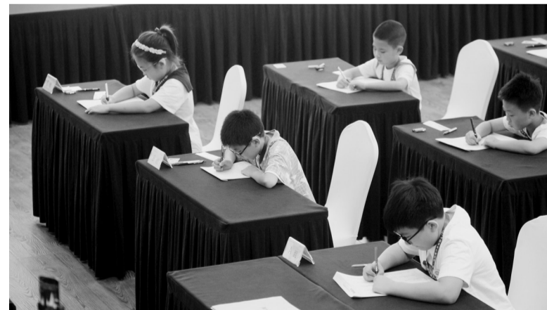
图为辽宁选手正在比赛。

本报讯 记者唐佳丽报道 8月11日,中国珠算心算协会举办第六届全国珠心算比赛。我省有9名选手分别参加了A组、B组和C组的团体赛和个人全能赛,选手年龄最大的