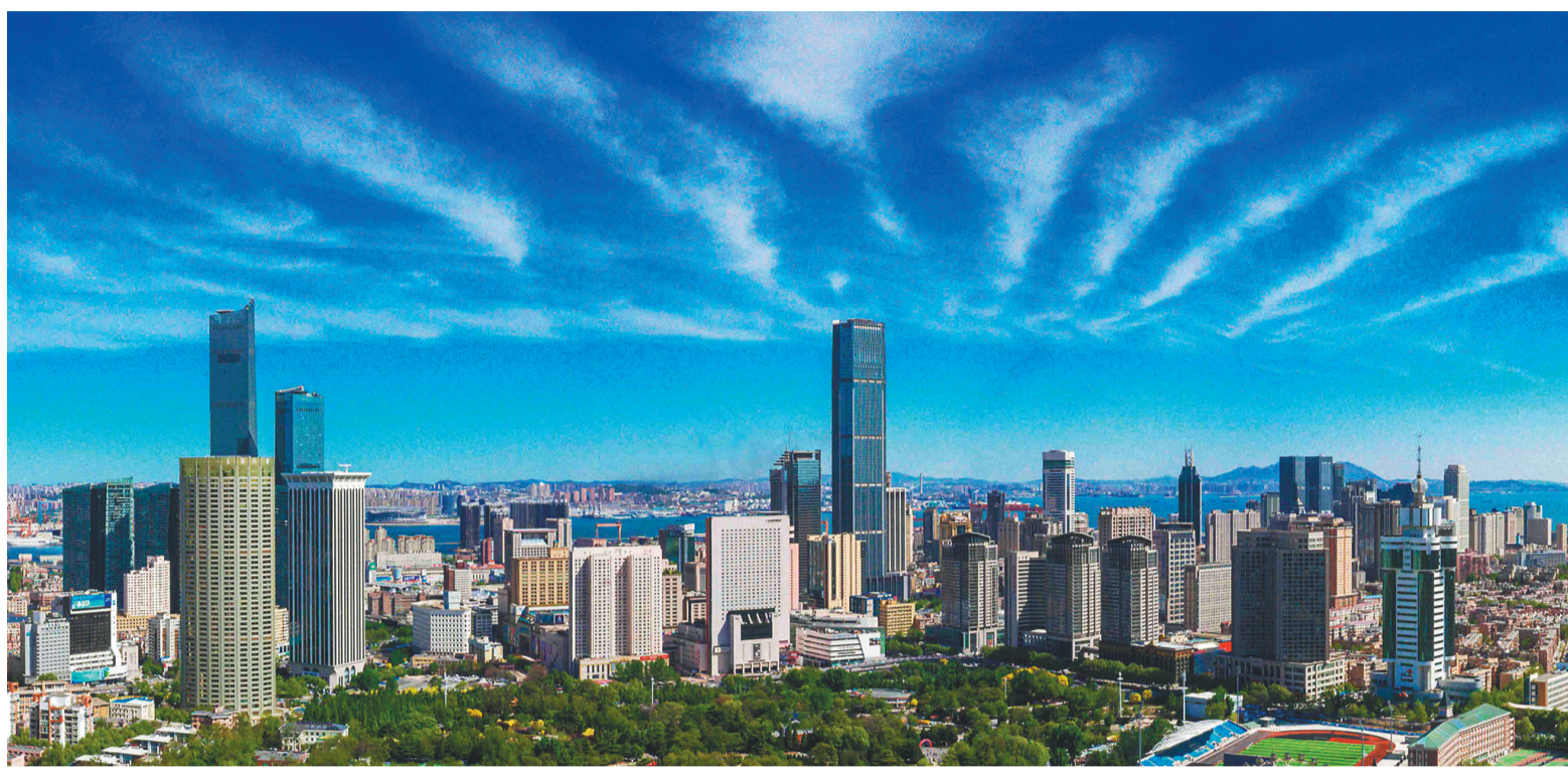
获评“全国社会信用体系建设示范区”进一步提升了大连的城市吸引力。