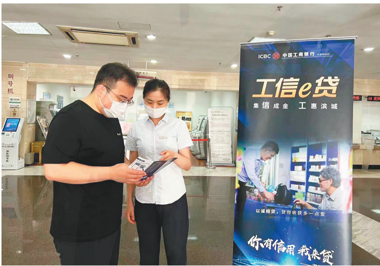
工商银行工作人员协助客户在线上申请“工信e贷”。

截至目前,“工信e贷”已为大连区域内3万多家优质信用小微企业主动预授信达110亿元,其中,制造业企业25亿元、科技型企业10亿元、乡村振兴14亿元。