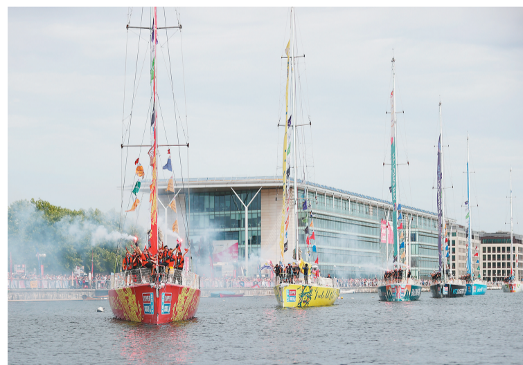
7月31日,总冠军青岛号(前)在伦敦皇家码头参加巡游活动。

这位热爱运动又喜欢挑战的中国姑娘此前完全没有航海经历,她参与了2019年底的第三赛段比赛。“最大的挑战一个就是没有手机信号,另一个挑战是此前从来没有真正到过远洋,有些情况还是很危险的,对体力和心理都是个挑战。”