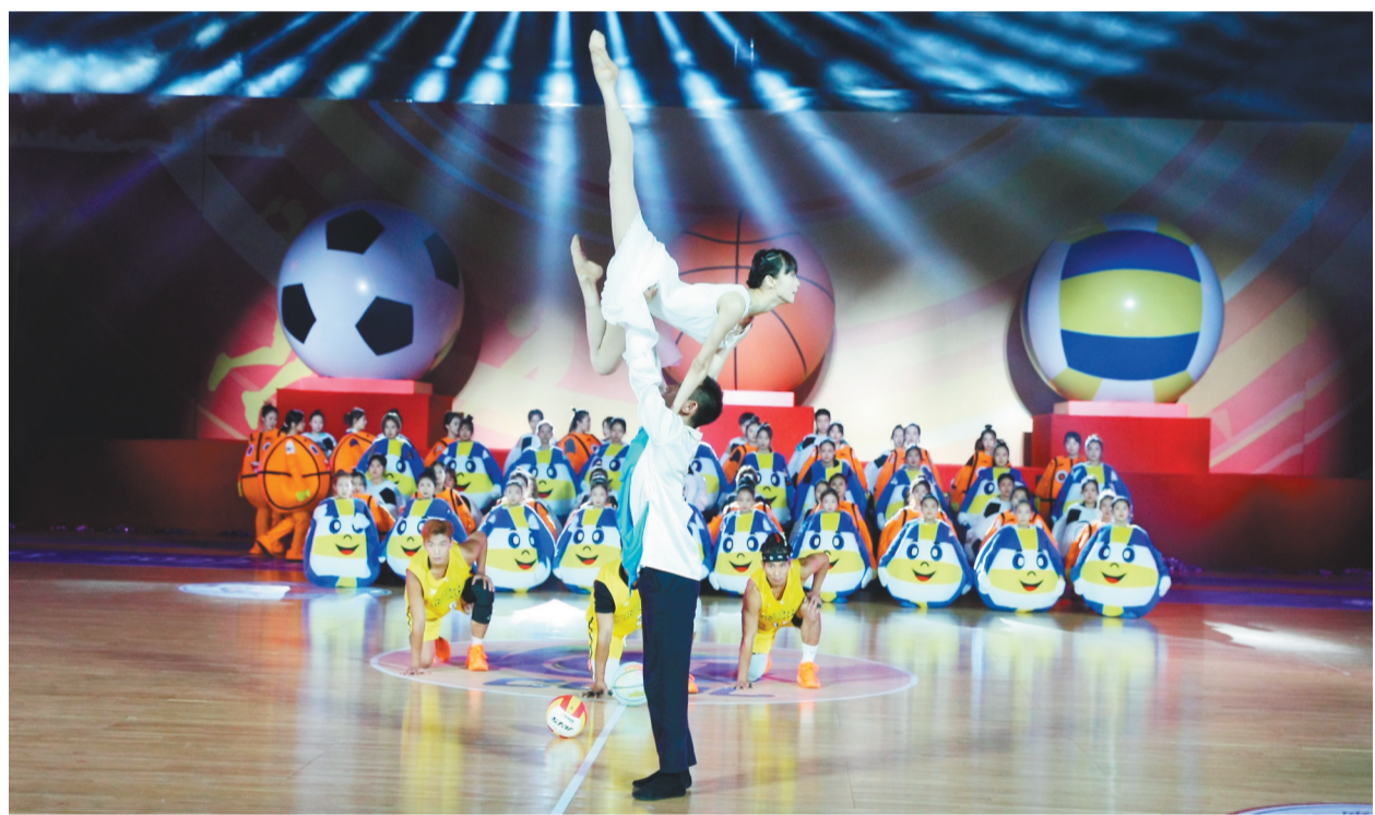
开幕式上的文艺表演。