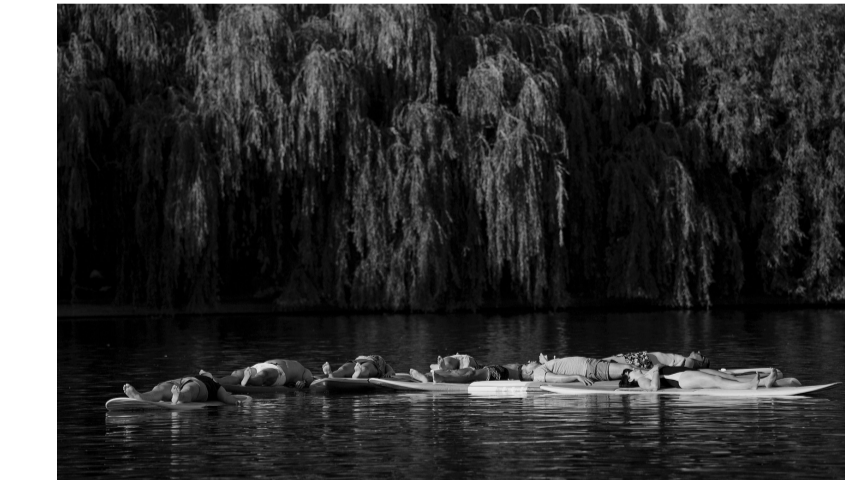
上图:7月26日,在美国俄勒冈州波特兰,一名男子坐在喷泉旁。 下图:7月26日,在罗马尼亚布加勒斯特,人们躺在水上滑梯上休息。 近日,北半球多地持续高温天气。

据新华社微特稿 英国一项研究显示,由于兴起外来宠物饲养热潮,英国近年来蛇咬伤人事件增多,有人伤势严重甚至死亡,专家因此提醒民众不要非法饲养外来宠物。 研究报告刊载于美国最新一期《临床毒物学》季刊,所引数据来源于英国国家毒物信息服务局,显示2009年至2020年间,这一机构共备案321起外来蛇类咬伤人事件,涉及68种蛇。而英国本土蛇类只有三种。300名受伤人员中,三分之二是男性,15人伤势严重,有人不得不截掉手指,还有人治身亡。另外,有72名伤员年龄不超过17岁,其中13人不满5岁。按照英国国家毒物信息服务局的说法,2009年前,蛇咬伤人事件相当罕见。