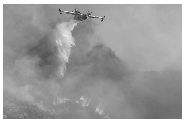
7月26日,在法国日尼亚克,飞机参与灭火行动。法国近期发生多起林火,酷热、干旱等因素增加了扑灭林火的难度。