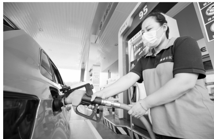
7月26日,山东省临沂市郯城县一家加油站工作人员为车辆加油。国家发展改革委26日称,根据近期国际市场油价变化情况,按照现行成品油价格形成机制,自2022年7月26日24时起,国内汽油、柴油价格每吨分别降低300元和290元。