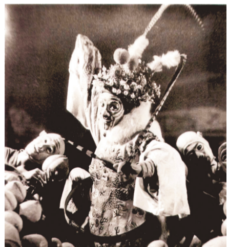
《孙悟空三打白骨精》剧照。