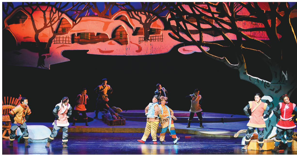
《大栓的小尾巴》剧照。

目前,国家对于儿童剧的发展十分重视,出台了一系列的帮扶政策,近期辽宁儿童艺术剧院推出的儿童剧《听说过没见过》就是国家艺术基金舞台艺术创作资助项目。作为一部精心创作的儿童剧,既具观赏性、艺术性又具有教育性,观看过此剧的专家一致认为,好剧可以引导孩子进行一次“心灵上的长征”。