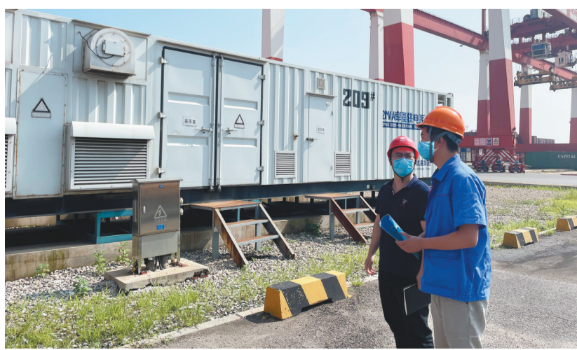
锦州供电公司工作人员进企业提供贴心服务。

锦州供电公司主动融入东北陆海新通道建设,持续推动管理创新、科技创新和服务创新,致力打造“辽·亮”供电服务品牌,为新通道建设提供坚强的供电服务保障。组建跨区服务,服务通道建设。锦州供电公司主动对接锦州港,全面实行“港口供电,一包到底”服务,助力新通道供电保障圈建设,组建跨区域供电服务联合行动小组,全力保障投资金额达130亿元的锦州港口集疏运体系建设工程,推进港