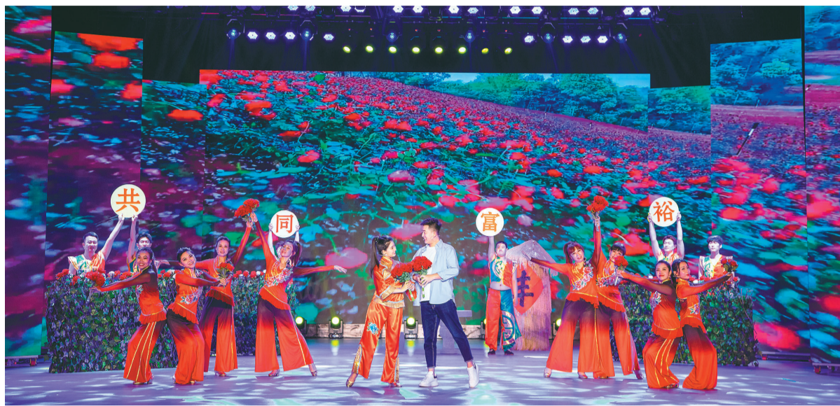
表演唱《城里的哥哥进山来》。

近日,由辽宁省文化和旅游厅主办的第十七届群星奖评奖落下帷幕,《星空对话》《婆婆还乡》《顺溜儿看瓜》等44部作品获群星奖。与往届相比,这届获奖作品既有地方特色浓郁的小辽剧,又有群众喜闻乐见的曲艺,还有京剧、评剧,汇聚了近年来全省群众文化艺术创作的优秀成果,展现了百姓的新生活,呈现出我省人民昂扬向上的精神风貌。