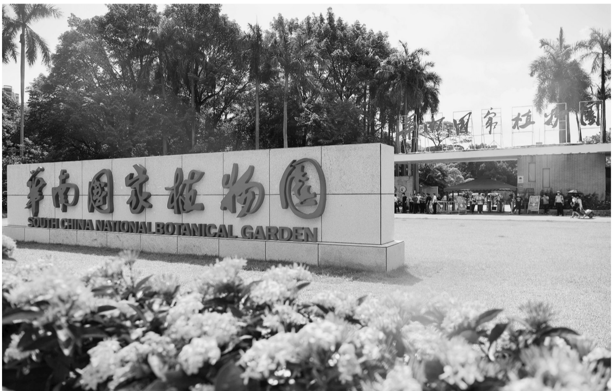
图为7月11日拍摄的华南国家植物园。