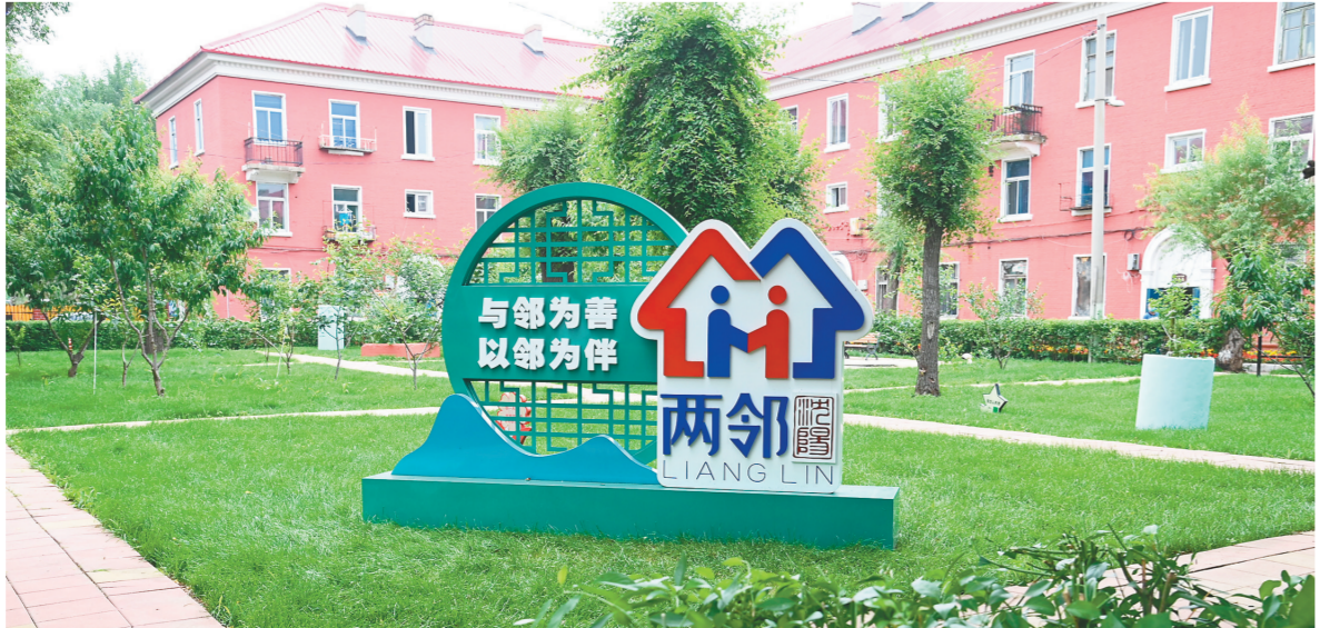
皇姑区千山小区“两部”楼景——和融园。

如今，“老房子”在践行“两部”理念、打造幸福家园中，不断聚人气、添动能、增活力。