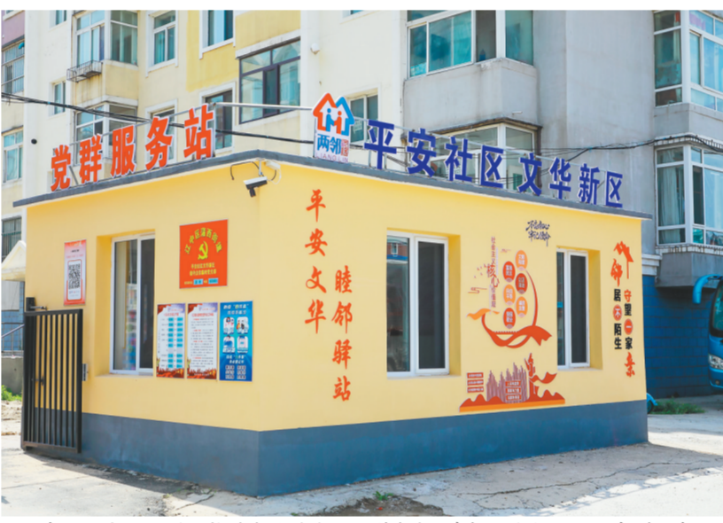
辽中区平安社区利用推进退休体教结合园合作契机，建成文华新区小区党群服务站。