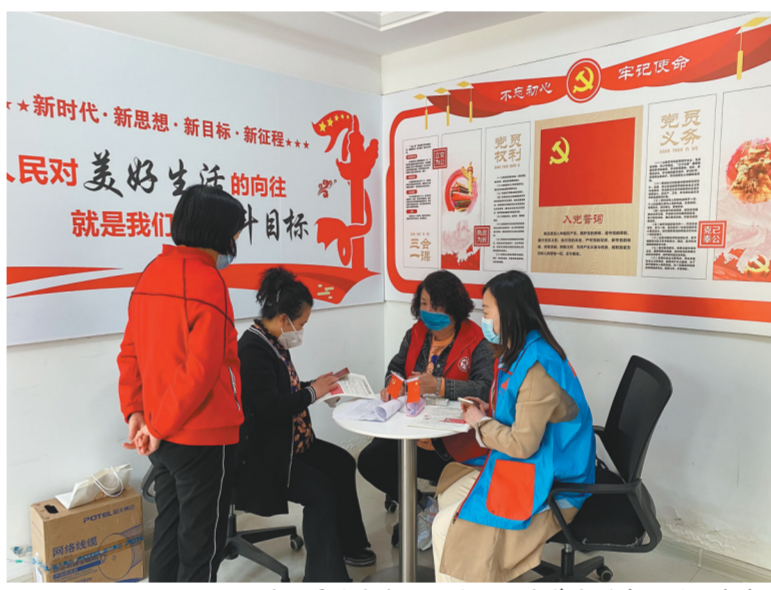
社区工作人员为老年居民办理居家养老服务紧急救援服务卡。