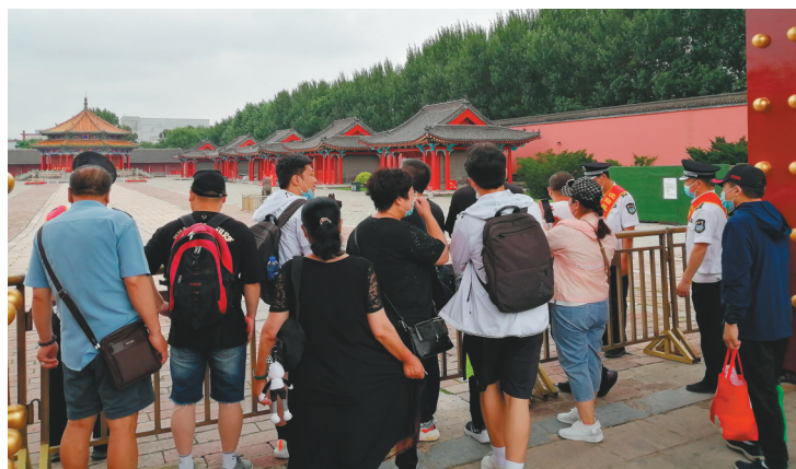
沈阳故宫逢周一闭馆时游客可以在东大门远观大政殿。

国博物馆逐渐形成每周一闭馆的“惯例”,原因主要是由于在周末参观人流最大,紧跟着的周一参观者会少许多。而经历过周末大人流后的博物馆,也需要一定“修整”。