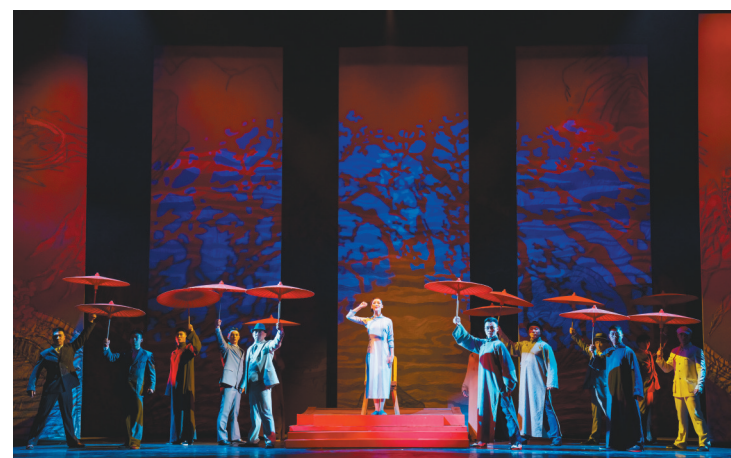
杂技主题晚会《旗帜》演出现场。

用历史故事、人物群像来诠释中国共产党人崇高的理想信念是大型杂技主题晚会《旗帜》所要表达的。《旗帜》由《呐喊》《曙光》《战